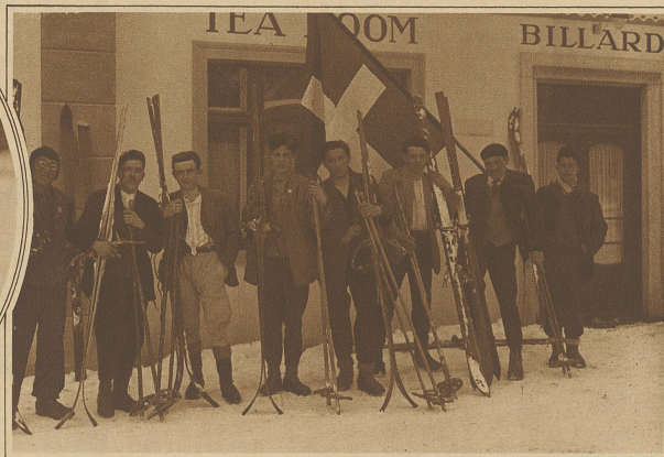
Teilnehmergruppe der Senioren am Langlauf