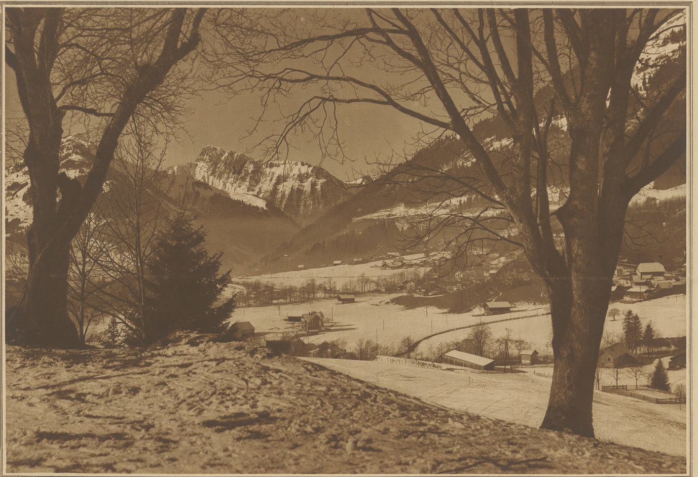
Winterzauber in Château-d'Oex