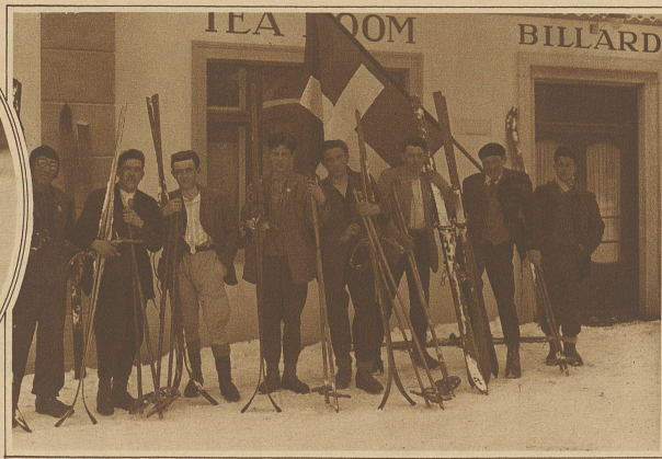
Teilnehmergruppe der Senioren am Langlauf