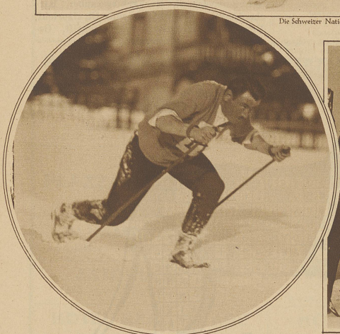
Langläufer unterwegs