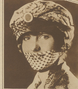
Die Schach-Schülerin, die immer dabei ist, in einem der besten Schach-Spielerinnen zu sein.