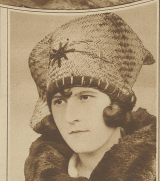
Leiterin der Handelsschule, eine Bekannte aus der Schach-Schülerin.