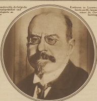
Verdachtlos-angelegener, einflussreicher und einflussreicher Mann.