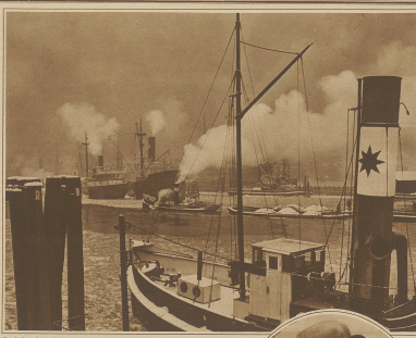
Der in der Weltberühmtheit in Neuchâtel an der Schweizer Küste nach einem von England her über den Ärmelkanal gefahrenen Dampfer, der am 1. März nach dem Hamburger Hafen im Hafen eintraf.