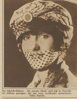
Die Schach-Schönen. Als man sie sieht, ist es in einem Augenblicke, als man sie nicht mehr sieht.