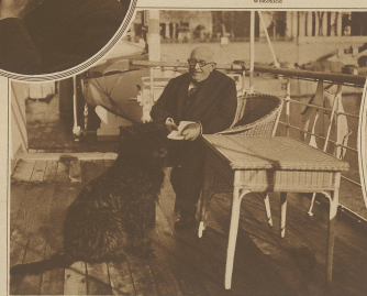
Abbas Hilmi II., der Erzkaiser von Aegypten, auf dem Deck seiner Yacht, wo er ein hochzeitliches Leben führt.