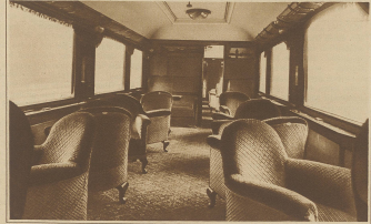
Blick in einen eleganten, nach amerikanischem Muster eingerichteten, ersten Salonsitz einer Klasse der Schweizer Bundesbahnen. Diese Wagen verkehren zwischen den Stationen der Strecke Bern-Luzern.