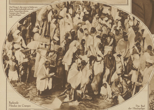
Badende Fischer im Canege.