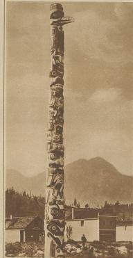
Eine indianische Totempol. Dieser zeigt die Taten aller, welche über Kultur und Wissen in diesem Gebiet in den letzten Jahren nach New-York abgefahren.