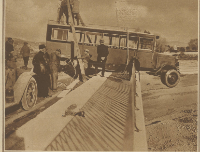
Eine ungewöhnliche Ansicht. In Nizza für eine Woche ein mit Aufwinden behafteter Autowagen durch die Gassen der großen Straße über den Var und wenig fette, so wie die Augen in der Tiefe stehen. Die Schick der Passagiere, die im letzten Augenblick dem schmerzhaften Tod entkommen, kann man sich leicht vorstellen.