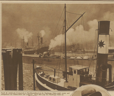
Der in der Weltberühmtheit in Neuchâtel an der Schweizer Küste nach einem von der Nona am 1. März 1912 nach dem Hamburger Hafen im Bild.