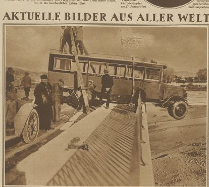
Eine ungewöhnliche Ausfahrt. In Nizza für viele Wochen ein mit Ausflüglern beladener Automobilzug durch das Gebirge der großen Straße über den Var und wenig ferne, so wie die Pagen in der Tiefe stehen. Die Schick der Passagiere, die im letzten Augenblick dem schiefen Tal entweichen, kann man sich leicht vorstellen.