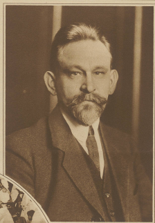
Der Reichs-Verkehrsminister Hermann Ammeling, der die Reichsverkehrsministerkonferenz in Berlin am 1. März 1912 eröffnete.