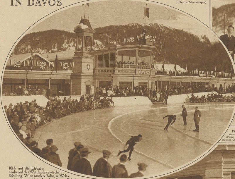
Blick auf die Eisbahn während des Wettlaufes zwischen Schilling, Wien (äußere Bahn) u. Weltmeister Skutnabb, Helsingfors (innere Bahn)