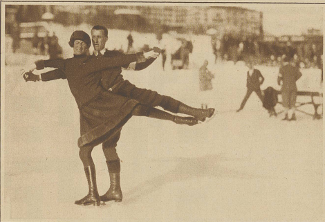
Miss Muckelt und Mr. Page, England, beim Paarlaufen