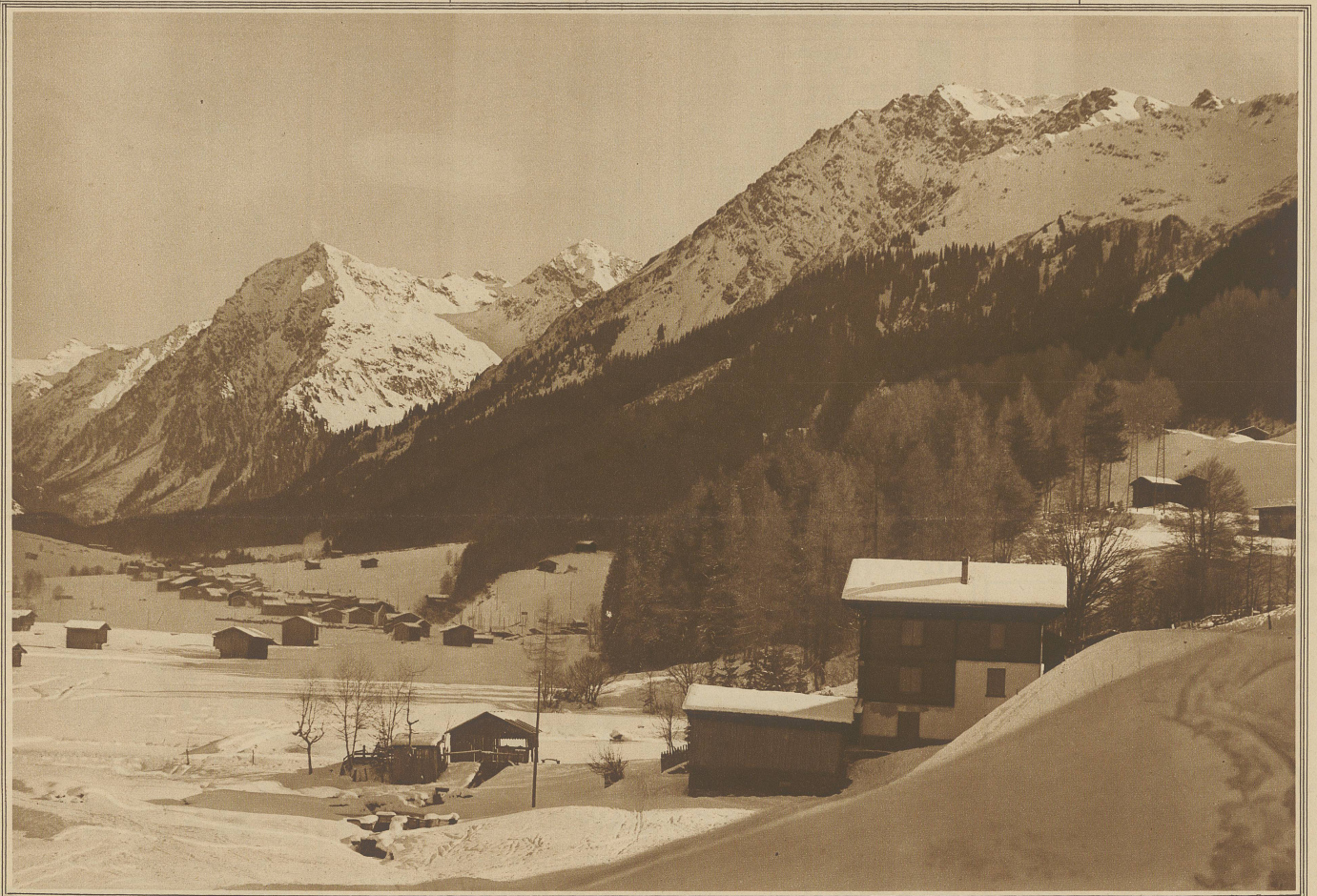
Wintermotiv aus Klosters