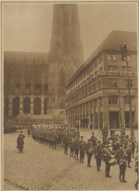
Unter klingendem Spiel verlassen die letzten englischen Truppen die Stadt