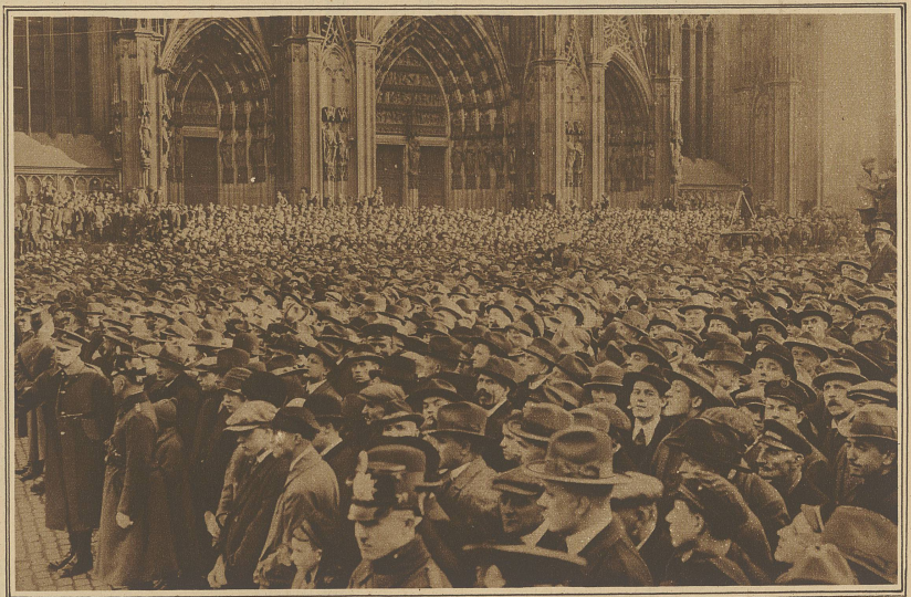
Die riesige Menschenmenge auf dem Domplatz während des Abzuges der Besatzungstruppen