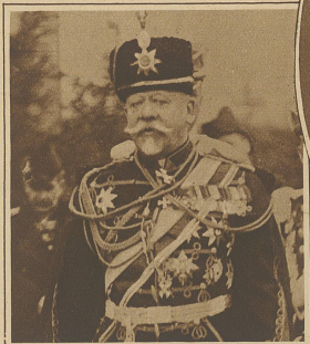
General Suchomlinow, der bei Kriegsausbruch russischer Kriegsminister war, ist am Dienstag im Alter von 77 Jahren in Berlin gestorben.