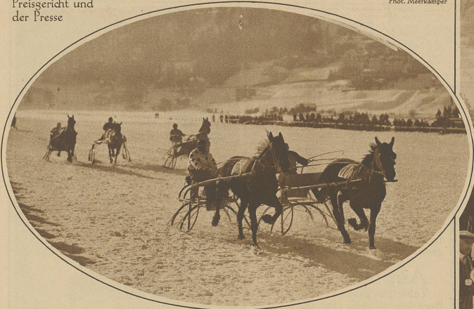
Momentbild aus dem Trabrennen «Preis von Chur»