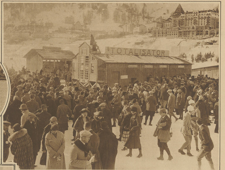
Hochbetrieb am Totalisator