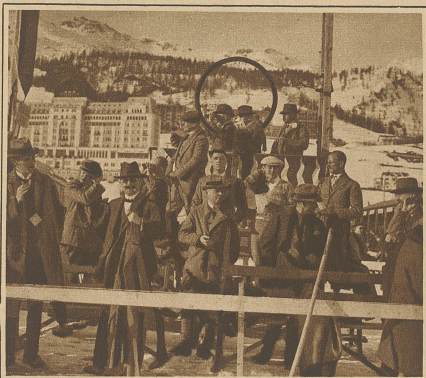
Die Zieltribüne mit dem Preisgericht und der Presse