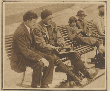
Der bekannte Schriftsteller Bernhard Kellermann (X) beim Wintersport in Engelberg