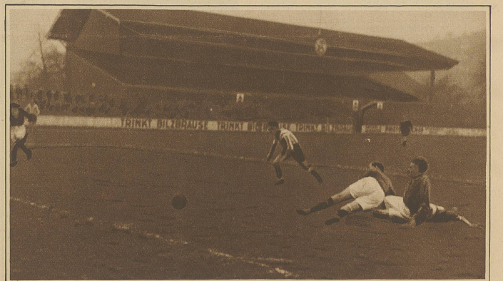
Vor dem Tor des F.C. Zürich