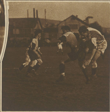
Grasshoppers-St. Gallen. Kampf um den Ball vor dem Tor der St. Galler