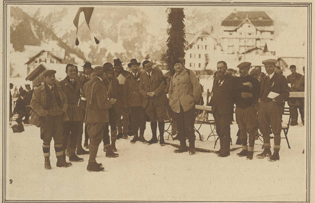
Die «Skispitzen» am Ziel