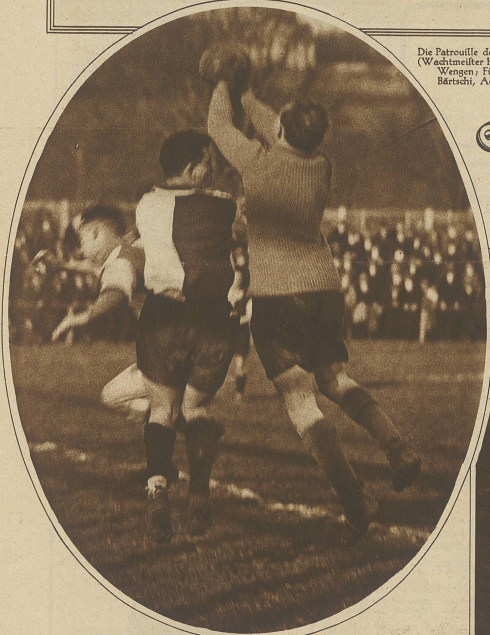
Prinz wehrt eine Ecke im Spiel Grasshoppers-St. Gallen 7:1