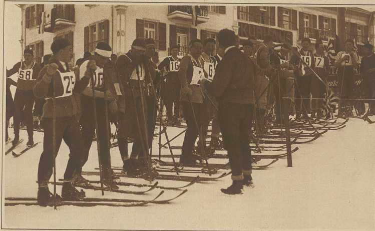
Start der Junioren auf der Kleinen Scheidegg

(Sonderaufnahmen für die Zürcher Illustrierte von W. Gabl, Wengen)