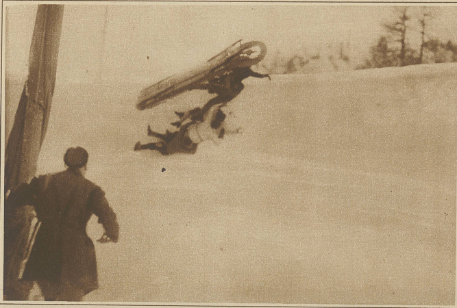
Ein gefährlicher Bobsturz anlässlich des großen Derby-Rennens vom 14. Februar in St. Moritz