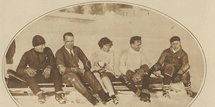
Die verunglückte Mannschaft, die, trotz der ungeheuren Fahrgeschwindigkeit im Moment des Unglücks, mit verhältnismäßig leichten Verletzungen davonkam

zen, zurück,» kündete er an. «Als dieses Gewitter losbrach, fühlte ich, daß es mir Unheil bringen werde. Es ist schlimmer geworden, als ich habe ahnen können. Ich kann nicht mehr. Ich muß gehen.» «Sie wollen also nicht singen?» fragte Madame. Er schlug die Arme übereinander, schloß die Augen und schauerte zusammen. «So können Sie einen populären Vorstadttenor fragen, ob er sich für einen Bazar zur Verfügung stellen wolle,» seufzte er. «Ich bitte Sie, Madame, lassen Sie sich von jemandem raten, der Fachmann ist. Erzählen Sie ihm, was Sie getan haben und folgen Sie seinem Rate. Ich bin nicht beleidigt, ich bin nur außer mir.» «Das Programm,» erklärte Madame ruhig, als er zum Abschied eine tragikomische Verbeugung inszenierte, «wird nächste Woche gedruckt. Sie wissen, was Sie zu tun haben, wenn Sie Ihren Verpflichtungsschein haben wollen. Hugh, sorgen Sie für Herrn Rapastos Wagen.» Hugh und Claire gingen auf die Terrasse hinaus, um Abschied zu winkeln. Der Boden war sturmdurchweicht. Die Blumen lagen in die Erde gehämmert. In der Ferne fiel immer noch schiefer der unaufhörliche Regen. Rapasto fuhr weg mit verschränkten Armen, in der Pose eines Napoleons. Claire lachte Tränen. «Wenn der nur wiederkäme,» rief sie. «Er wird wiederkommen,» erklärte Cardinge. (Fortsetzung folgt.)