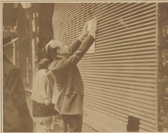
Ein Proteststreik der Pariser Kaufleute. Ein Ladenbesitzer schließt sein Geschäft zum Protest gegen die neuen Steuergesetze