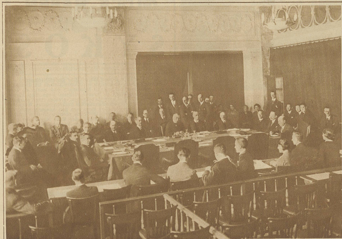
Die Sitzung des Völkerbundsrates vom 12. Februar in Genf, anlässlich welcher über den Eintritt Deutschlands und über die Erhöhung der Zahl der ständigen Ratsmitglieder diskutiert wurde