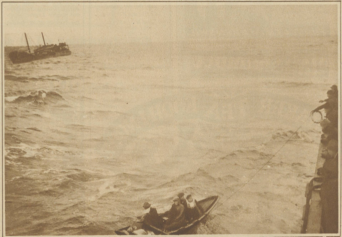
Das stürmische Wetter der letzten Tage hat eine große Anzahl Schiffe in schwere Seenot gebracht. Unser Bild zeigt im Hintergrund den norwegischen Dampfer «Pinto», dessen Besatzung kurz vor Versinken des Schiffes vom amerikanischen Dampfer «Caspar» aufgenommen werden konnte. Im Vordergrund: Einholen des letzten Rettungsbootes