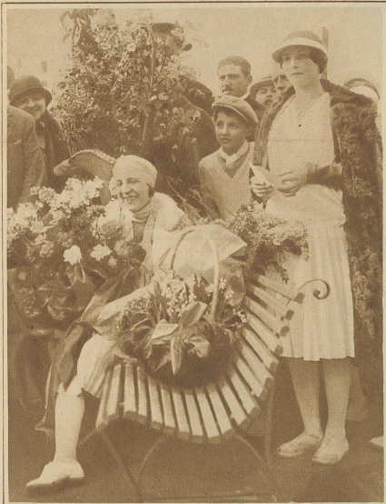
Nach dem sensationellen Tennismatch in Cannes. Sitzend: die Siegerin Suzanne Lenglen, hinter ihr die amerikanische Meisterin Helen Wills