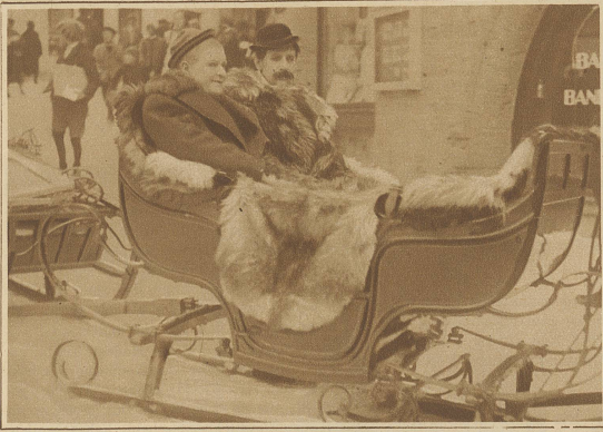
Die beiden berühmten dänischen Filmkomiker Pat und Patachon auf einer Spazierfahrt in St. Moritz