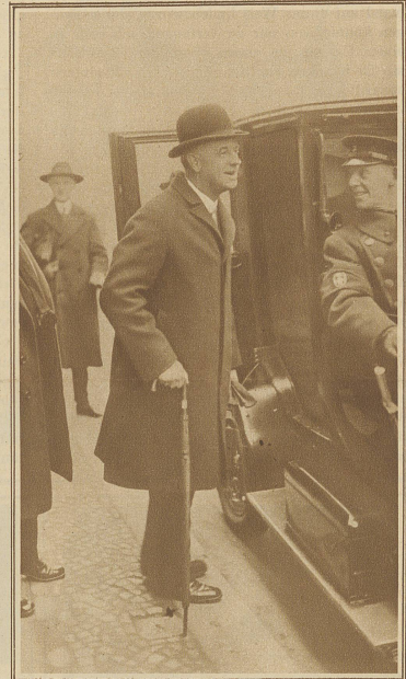
Sir Drummond, der Generalsekretär des Völkerbundes, bei seiner Ankunft in Berlin, wohin er sich zur Besprechung einiger Fragen, die mit dem Eintritt Deutschlands in den Völkerbund zusammenhängen, begeben hat