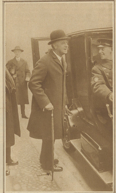
Sir Drummond, der Generalsekretär des Völkerbundes, bei seiner Ankunft in Berlin, wohin er sich zur Besprechung einiger Fragen, die mit dem Eintritt Deutschlands in den Völkerbund zusammenhängen, begeben hat