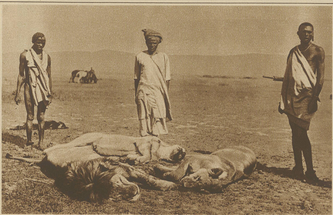
Die Eingeborenen mit ihrer Jagdbeute

Unser Publikum, das von fremden Ländern,