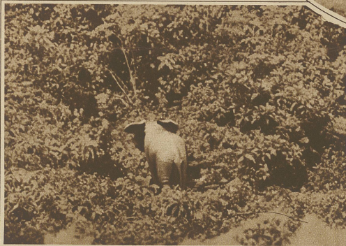
Wutschnaubend flüchtet sich ein Elefant vor unserer Kamera in das Dickicht des Urwaldes

Als ich zum erstenmal 1907 in Nairobi, der Hauptstadt der heutigen Keniaprovinz (früher Britisch Ost-Afrika) weilte, kamen noch sehr häufig nachts Löwen in die Stadt. Eingeborne mit langen Speeren, die statt des Schamätleins nur auf dem Rücken ein kleines Lederstückchen trugen, sah man neben den Frauen