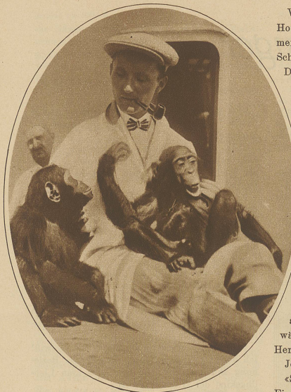
Die Lieblinge der Expedition