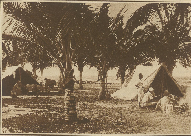
Rast der Expedition. Die Forscher suchen in einem schattigen Palmehain Schutz vor der Tropensonne