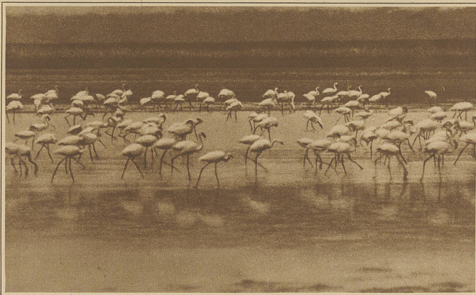
Ein Schwarm Flamingos am Flußufer

Mit beiden Beinen ist der Kamerajäger aus dem Bett, ein kurzer Zuruf hat die im Halbschlaf liegenden Kameraden verständigt. Schnell