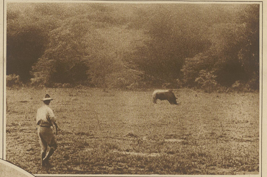
Aesendes Nashorn in einer Lichtung des Urwaldes

Als die beiden Herren am Kilimandjaro ankamen, lagen hier drei englische und amerikanische Filmexpeditionen, die vergeblich versucht hatten, den Berg zu stürmen. So war es denn kein Wunder, daß auch den beiden Ankömmlingen eine baldige enttäuschungsreiche Rückkehr prophezeit wurde. Aber sie ließen sich nicht beirren und machten sich frohgemut mit ihren erprobten Schwarzen an den Aufstieg. Das für alle Bergsteiger aber Inter-