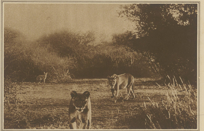
Die Löwen haben unsern Standort entdeckt und versuchen unsern Apparat aus der Nähe zu besichtigen. Auch der Skakal im Hintergrund will sich das Schauspiel nicht entgehen lassen.

Damit war die erste große Aufgabe, die sich diese Filmexpedition gestellt hatte, gelöst, der erste Rekord aufgestellt. Aber noch galt es anderes, vielleicht schwereres zu leisten, denn es kam ja darauf an, auch in Tieraufnahmen alle Vorgänger zu schlagen.