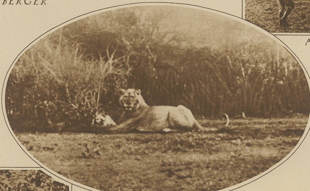
Das surrende Geräusch des Kurbelkastens hat den Löwen aus dem Schlafe gerüttelt

die zu bereisen sein Geldbeutel nicht ausreicht, in den Lichtspieltheatern etwas sehen will, verlangt aber trotzdem möglichst Ursprüngliches, bisher noch nicht Gebotenes. Schwer ist es da für den Reisenden, der natürlich mit der Zeit mitgegangen und sich einen Kurbelkasten angeschafft hat, die Wün-