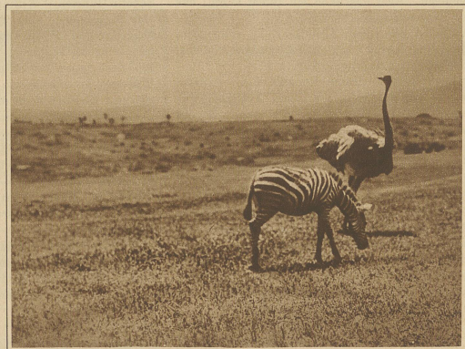
Zebra und Strauß weiden in Reichweite der Kamera

Noch reißen und kaudend werfen sie auf, mißtrauisch senkt eine mächtige Löwin den Kopf, äugt herüber nach dem Dornbusch. Einen Augenblick stoppt der Kurbeler. Da wirft sie auf, die Unterbrechung des Geräusches hat sie aufhorchen lassen. Doch ein junger Löwe rettet die Situation, dicht neben ihr reißt er sich ein gehöriges Stück Fleisch ab, da siegt die Gier über die Vorsicht: mit einem wilden «rruff» fährt