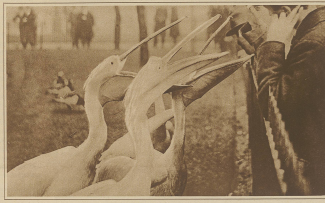
Pfликane des Leipziger Zoos lassen sich vom Publikum mit Leckerbissen füttern.