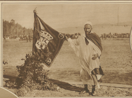
Zur Wiedereröffnung der Albatrossen in marokkanischen Kongo. Ein Mann der Region de Mafra mit den von der spanischen Königin Viktoria dieser Gruppe übergebenen Bannern.