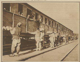
Wie man in China reist. Auf einer kleinen Station der Pekinger Eisenbahn. Ausser den Fracht- und Lebensmittelwagen sind auf einer durchgehenden Perlenbahn.