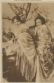
Zwei baltische Späterinnen in ihrer Nationaltracht anlässlich des Karnevals in Madrid.