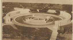
Die Architektur des neuen Nationalstadions in Zürich ist ein gutes Beispiel für die Anwendung der modernen Baukunst. Die Stadien sind von der Firma der Maschinenfabrik Oerlikon in Zürich konstruiert.