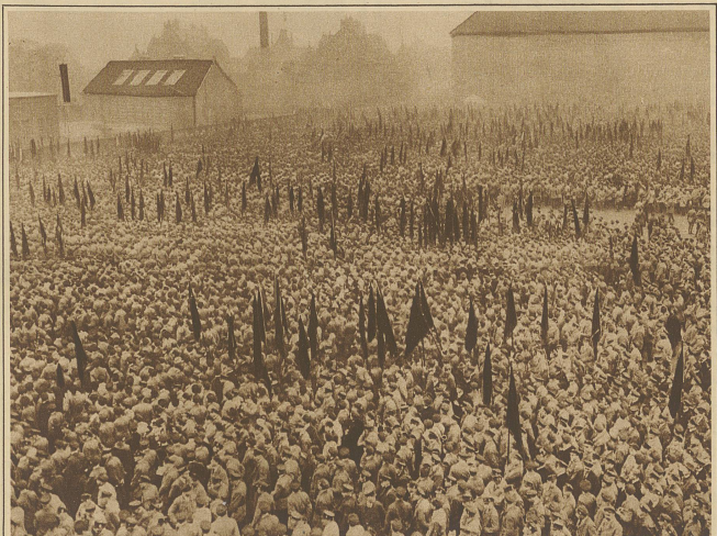
Ueber 100000 Reichsbanner-Leute aus allen Gauen Deutschlands trafen sich letzten Sonntag zur zweiten Bundesgründungsfeier. Unser Bild zeigt einen Blick auf die Versammlung mit den unzähligen Fahnen auf dem Sportplatz vor dem Lübecker Tor