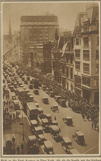
Blick in die Park Avenue in New York, die als die Straße mit der höchsten Automobilfrequenz gilt. Am Kreuzungspunkte der Park Avenue mit der berühmten Fünften Avenue wurden kürzlich folgende Zahlen notiert: Pro Minute passierten die Park Avenue 48 Automobile, während die "Fünfte" im gleichen Zeitraum nur von 40 durchfahren wurde. Zwischen 7 Uhr früh und 7 Uhr abends verkehrten an den Zählungsstellen 86597 Wagen in der Park Avenue und 83582 in der Fifth Avenue