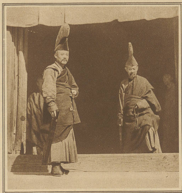
Zwei hohe buddhistische Würdenträger