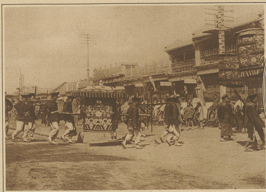
Eine bürgerliche Hochzeit, die immer noch mit altem Pomp und zeremoniellen Bräuchen gefeiert wird