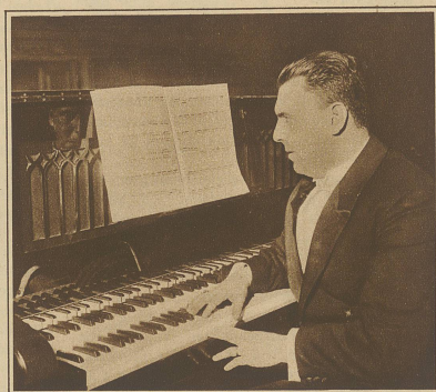
Letzte Woche fand in Berlin das erste Konzert mit dem Vierteltonklavier statt. Unser Ohr wird dieser neuesten Erfindung wohl nur zögernd zu folgen vermögen. Das Bild zeigt den Komponisten Schulhoff am neuen Instrument