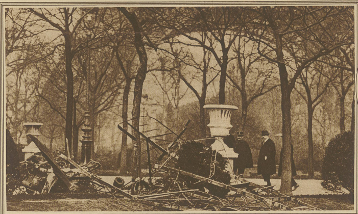
Auf Grund eines Vertrages mit einem Filmunternehmen versuchte am Mittwoch der französische Militärflieger Collet unter dem Bogen des Eiffelturmes hindurchzufliegen. Das Waggestück gelang ihm auch, doch fiel der Apparat beim Wiederaufrichten gegen eine Antenne des Radioturmes auf dem Marsfeld und stürzte ab. Der Flieger wurde als verkohlte Leiche unter den Trümmern hervorgezogen. Unser Bild zeigt den zerschmetterten Apparat und im Hintergrund den Bogen des Eiffelturmes