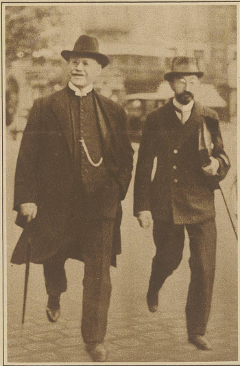
Ein dänischer Bischof wegen Geldbetrügereien angeklagt. Vor dem Landesgericht in Kopenhagen findet diesem Monat der Prozess gegen Anton Rest, den Bischof der methodistischen Gemeinde, statt, der ihm anvertraute Gelder statt zur Unterstützung armer Leute für seine eigenen Bedürfnisse verwendete. Ebenso gingen große Summen durch mangelhafte Buchführung verloren. Bischof Anton Rest (links) mit seinem Verteidiger