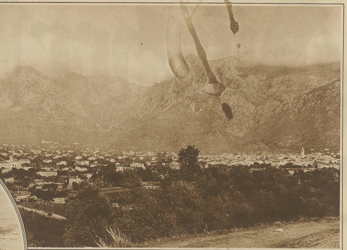
Blick auf das langgestreckte Städtchen Soller an der Nordwestküste der Insel, berühmt ob seiner Orangenausfuhr. Die Orangen von Soller gelten, obwohl sie sehr klein sind, als die besten der Welt. Unmittelbar hinter dem Städtchen erhebt sich der Buig Mayor (1445 m) der höchste Gipfel der Insel

Aber ein Hauch der modernen Zeit ist trotzdem auch nach Mallorca gedrungen. Schon die Sand hatte unrecht, als sie schrieb, daß auf der Insel «jegliche Industrie mangle»; denn die Töpferei wurde auf Mallorca seit alters gepflegt und ihre Erzeugnisse genossen solchen Ruf, daß das Wort «Majolika» — eine Verballhornung des Wortes Mallorca — geradezu zur Bezeichnung der Gattung der kunstvoll überglasierten Töpfereien wurde. Heute aber qualmen in Palma, der Hauptstadt, und in einigen anderen Orten der Insel die Fabrikschornsteine wie anderswo, wenn auch in beschränkter