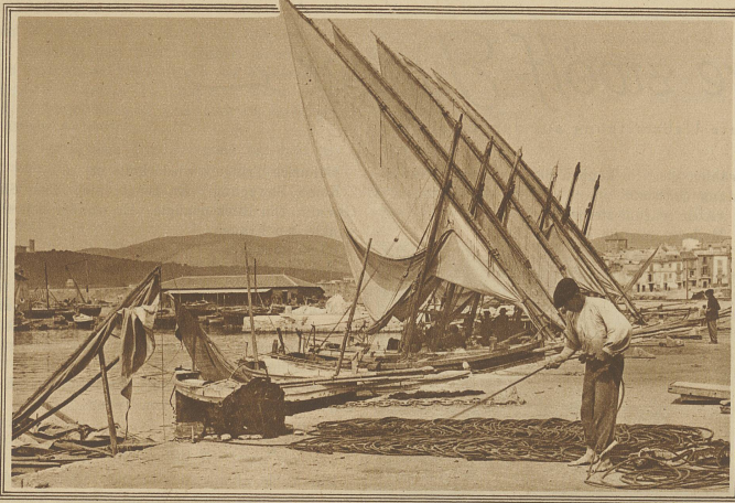
Stimmungsbild am Hafen von Palma. Fischer beim Prüfen seines Tauwerkes; dahinter zum Trocknen aufgespannte Segel. Links im Hintergrund das alte Königsschloß Bellver