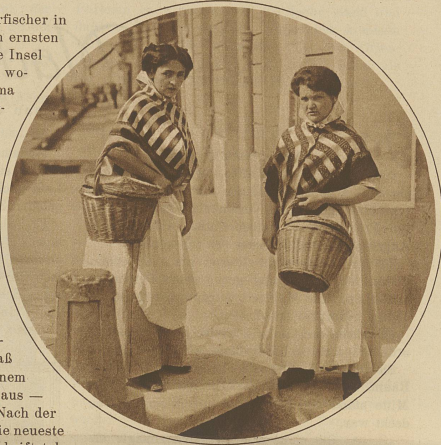
Landestübliche Tracht der Einwohnerinnen von Palma: großgemustertes Schal mit dem «Reboillo», einem unter dem Kinn geschlossenen, meist auf den Nacken herabfallenden Keppftuch aus weitem Tüll

Lust hat — das Leben der Mittelmeerfischer in all seinen Erscheinungsformen — den ersten und den heiteren — studieren. / Die Insel zählt heute rund 333000 Einwohner, wovon etwa 70000 auf die Hauptstadt Palma entfallen. Ihre Sprache ist das «Mallorquinische», eine dem Katalonischen verwandte Mundart, aber reichlich mit arabischen Bestandteilen durchsetzt. Die Insel umfaßt 3648 qkm, ist also etwas mehr als doppelt so groß wie der Kanton Zürich. Trotz der Entwicklung des modernen Verkehrs ist die Insel kein Touristenziel im weiteren Sinne geworden, wie sie ob ihrer Eigenart sicher verdiente. Abseits der üblichen Seeverkehrswege gelegen, ist Mallorca für den Durchschnittsreisenden un bequem zu erreichen, und so kommt es, daß in der Hauptsache Franzosen — dank einem direkten Schiffverkehr von Marseille aus — zu den Besuchern der Insel zählen. Nach der Sand haben sich in Frankreich, bis in die neueste Zeit hinein, eine ganze Reihe von Schriftstellern in mehr oder weniger guten Schilderungen mit Mallorca befaßt. Ihren eigentlichen Entdecker aber haben die balearischen Inseln — und insbesondere Mallorca — in dem (während des Weltkrieges gestorbenen) Erzherzog Ludwig Salvator von Oesterreich