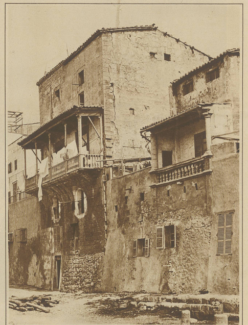
Blick auf die alte, gegen das Meer zu gelegene Stadtmauer von Palma. In die Mauer wurden, wie im Bilde ersichtlich, Wohnungen eingebaut