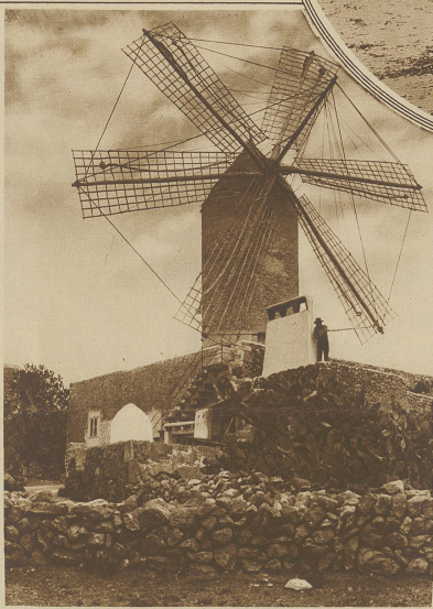
Typische Windmühle im Flachland der Insel. Die Mühle wird mit Segeln getrieben, die auf dem Bilde aufgerollt sind. Das Dach mit dem Räderwerk ist nach der Windrichtung verstellbar

die kleinere Insel Menorca und einige benachbarte Inselchen zählt) den Namen gegeben haben. Man leitet die Bezeichnung «Balearen» von dem griechischen Worte für «schleudern» ab. Im Verlaufe der punischen Kriege wurde Mallorca 123 v. Chr. von den Römern unter dem Konsul Q. Cæcilius Metellus erobert; er erhielt dafür den Beinamen «Balearicus», und wie vorher für die Karthager, so wurden die Inselbewohner jetzt als Schleuderer im römischen Heere verwendet. 3000 römische Ansiedler wur-