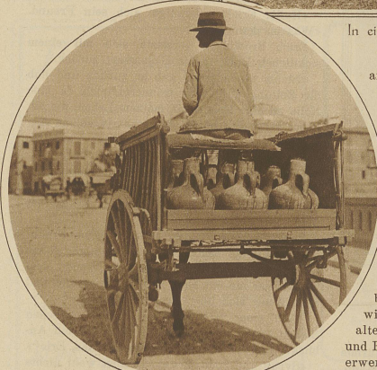
Ein Wasserverkäufer auf der täglichen Rundfahrt zu seinen Kunden

Landhaus, das er sich inmitten seines Besitzes errichtet hatte, gab er den Namen Miramar , und hier verbrachte er sein Leben lang inmitten seiner Bücher und seiner Sammlungen, wenn er nicht irgendwo im Innern nach Steinen grub oder nach alten Volkssagen forschte. Ob Mallorca jemals ein Reiseziel größeren Stiles und damit — wie es so schön heißt — «dem Fremdenverkehr erschlossen» werden wird, muß, solange das Dampfboot nicht gänzlich vom Flugzeug verdrängt wird, bezweifelt werden. Wer die Insel in ihren stillen Schönheiten und die Bevölkerung in ihrer kindlichen Anspruchslosigkeit kennen gelernt hat, möchte fast wünschen, daß dem paradiesischen Eiland diese Fortentwicklung erspart bliebe.