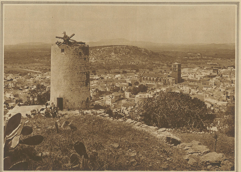
Blick auf das Städtchen Felanitx im Flachland der Insel, nahe der Ostküste gelegen und berühmt ob seiner kunstvollen Töpfererei, die schon im Altertum großen Ruf genossen. Im Vordergrund eine verfallene Windmühle