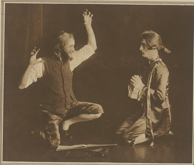
Zauberszene aus Mozarts Singspiel «Bastien und Bastienne», aufgeführt von der Zürcher Singspielbühne