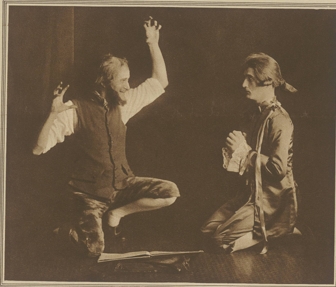
Zauberszene aus Mozarts Singspiel «Bastien und Bastienne», aufgeführt von der Zürcher Singspielbühne