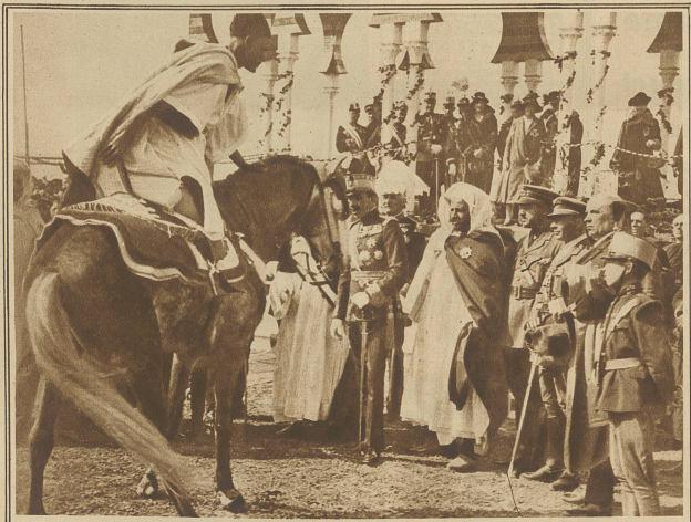
Abd-el-Kader schenkt dem König von Spanien eines der besten arabischen Pferde zum Zeichen der treuen Waffenbrüderschaft im marokkanischen Kriege