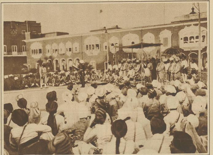
Bild aus dem Zeremoniell der Krönungsfeier im großen Hofe des Königspalastes