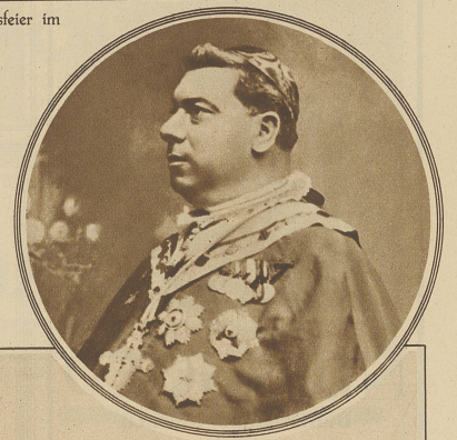
Bild rechts Kardinal Benlloch, Erzbischof von Burgos, ist in Madrid gestorben