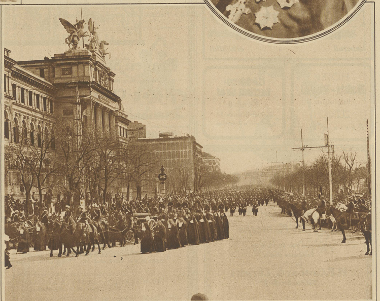
Blick auf den imposanten Trouerzug zu Ehren des in Madrid verstorbenen Kardinals Benlloch