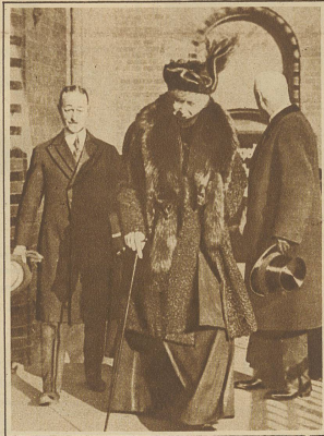
Die Königin-Witwe Luise von Dänemark, die Mutter König Christians X., ist im Alter von 75 Jahren im Schloß Amalienborg in Kopenhagen an einer Lungenentzündung gestorben