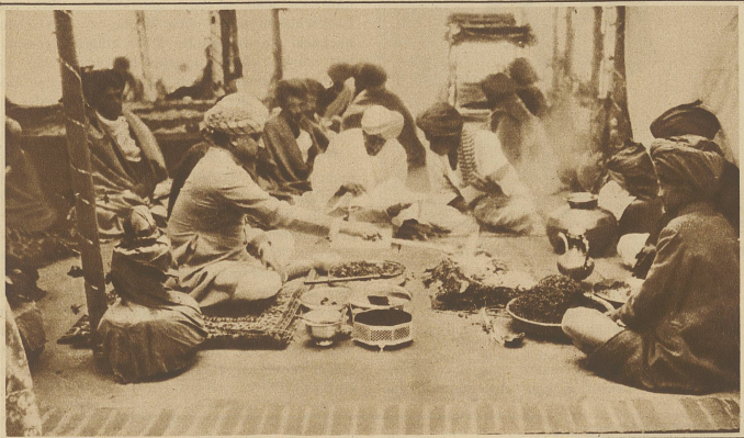
Hari Singh sieht nach der Krönungsfeier 14 Tage lang, täglich 5 Stunden, im Tempel, während die Hindupriester ihre Gebete vollziehen und opfern am Heiligen Feuer allerlei Produkte des Landes. Von Zeit zu Zeit wird das Feuer durch geheiligtes Wasser aus allen Flüssen und Seen des großen Reiches ausgelöscht und dann von neuem wieder entzündet

Nach dem Tode seines Vaters wurde Sir Hari Singh mit dem märchenhaften Prunk indischer Tradition zum Maharajah von Kaschmir gekrönt. Er zählt zu den reichsten Fürsten Indiens und weilt, als großer Freund europäischer Kultur, öfters in London und Paris