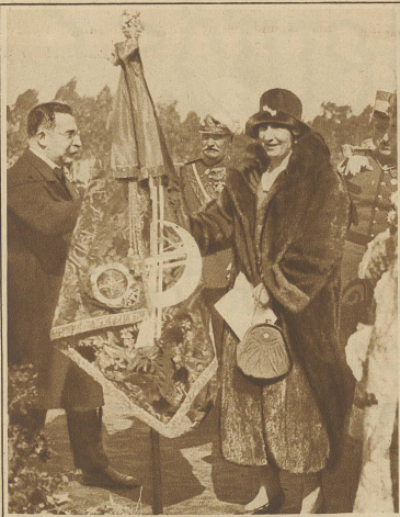
Die spanische Königin empfängt aus den Händen des Alcaido von Malaga das Banner der von der Marokkofront zurückgekehrten spanischen Regulares