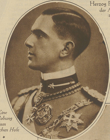
Eine Verlobung am italienischen Hofe