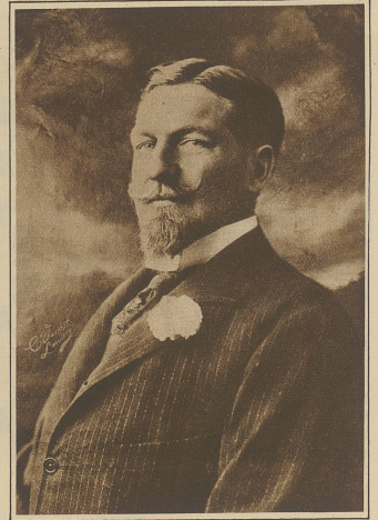
Herzog Philipp von Orleans, der Anwärter auf die französische Kaiserkrone, ist im Exil gestorben