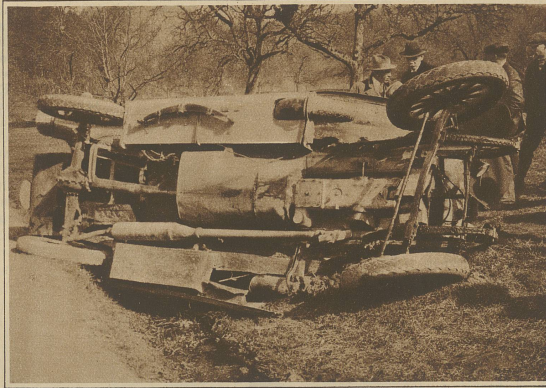
Zum Autounfall auf der Waldegg bei Birmensdorf Der dem österreichischen Generalkonsul in Zürich gehörende Wagen fuhr anlässlich einer Probefahrt mit großer Geschwindigkeit über die Straßenböschung und wurde stark beschädigt. Die beiden vorderen Insassen erlitten beim Sturz schwere Verletzungen