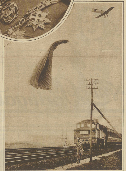
Eine gefährliche aber noch glücklich abgelaufene Landung mußte kürzlich ein Berliner Fallschirmjäger vornehmen. Er sprang aus 850 Meter Höhe glücklich ab, wurde jedoch vom Winde auf die Gasse einer Bahnhalle getrieben, wo sich der Fallschirm in den Telegraphendrähten verlor. Ein im selben Moment die Strecke passender Eisenbahnzug konnte noch rechtzeitig zum Halten gebracht werden