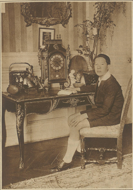
Der junge, erst 12jährige Kaiser von Anam, Bao Dai, ist zur Fortsetzung seiner Studien nach Paris zurückgekehrt. Unser Bild zeigt ihn in seiner neuen Wohnung. Die Bronzebüste auf dem Tisch ist ein Andenken an seinen kürzlich verstorbenen Vater