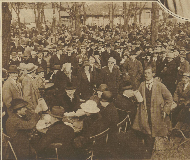
München im Banne des Salvatorbieres. Alle großen Bierhallen sind täglich bis auf den letzten Platz überfüllt. Die begeisterten Münchener Biertrinker schrecken sogar, trotz der Kälte, nicht davor zurück, im Freien ihren unermeßlichen Durst zu stillen