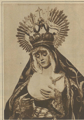
Detailbild aus dem Heiligtum »Die Madonna von Reglia« in der Karfreitagprozession in Sevilla