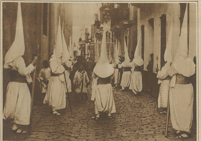
Die verummten Mitglieder der Bruderschaft durchziehen die engen Straßen von Sevilla