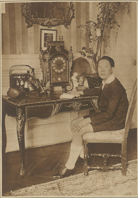
Der junge, erst 12jährige Kaiser von Anam, Bao Dai, ist zur Fortsetzung seiner Studien nach Paris zurückgekehrt. Unser Bild zeigt ihn in seiner neuen Wohnung. Die Bronzebüste auf dem Tisch ist ein Andenken an seinen kürzlich verstorbenen Vater