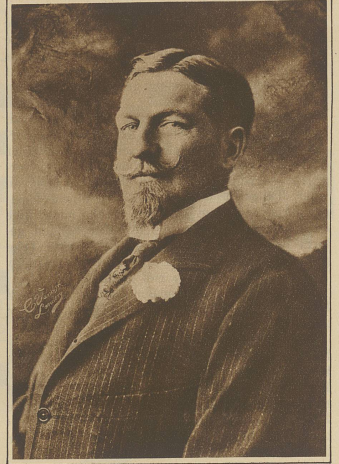
Herzog Philipp von Orleans, der Anwärter auf die französische Kaiserkrone, ist im Exil gestorben