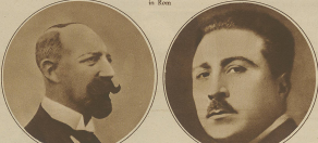
Die beiden Hauptstädter... (Text describing the portraits)