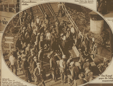
Der Kampf... (Text describing the scene)