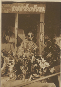
Die Berliner Hauptstadt... (Text describing the scene)