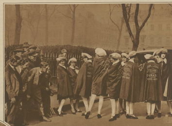
Einem englischen... (Text describing the scene)