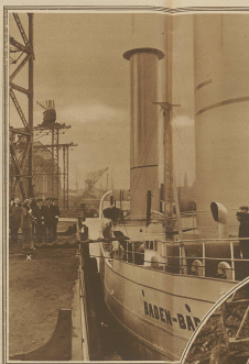
Fräulein Dietrich (K.)... (Text describing the ship)