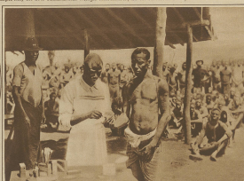
Der Kampf... (Text describing the scene)