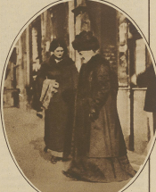
Der Kampf... (Text describing the scene)