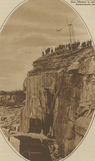
Ein weiblicher... (Text describing the scene)