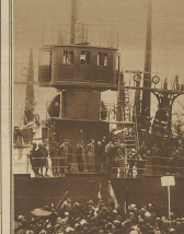
Ein weiblicher... (Text describing the scene)