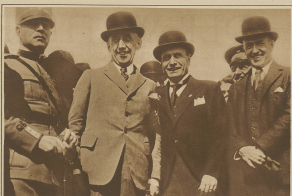
King Amalio und Minister Arm in Arm gefolgt, die Übergabe des Luftschiffes N. L. an den belgischen Nachfolger.