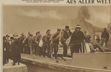
Die belgische... (Text describing the scene)