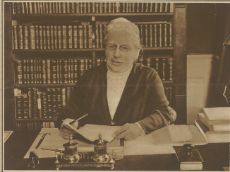
Ein weiblicher... (Text describing the woman)