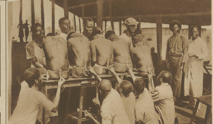
Der Kampf... (Text describing the scene)