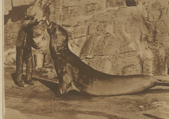
Ein weiblicher... (Text describing the scene)