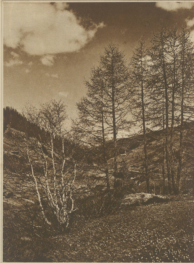
Vorfrühling in den Bergen

Nun führten ihn die Reiter heran, er sollte erschossen werden. Als der Steiner die Reiter und den Alten sah, rief er sie an: