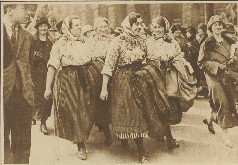
Große Frauendemonstration in London