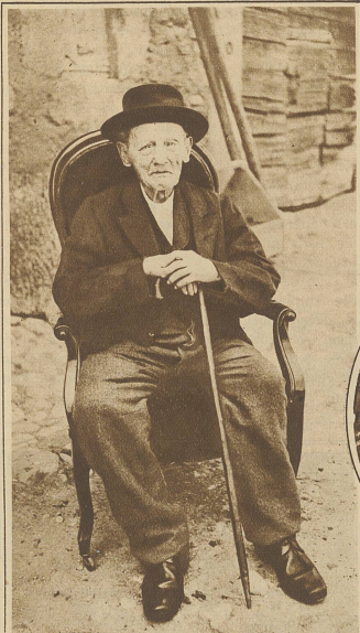
Jacq. Franç. Baudat, v. Arnex (Waadt), der älteste Schweizer, ist im Alter von 104 Jahren gestorben