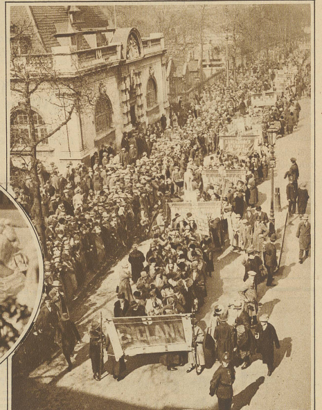
25,000 Frauen aller Gesellschaftsklassen aus den verschiedensten Gegenden Englands veranstalteten letzte Woche in London eine große Antireiكدemonstration Der Demonstrationzug unterwegs zur Albert Hall