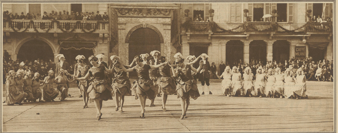
Tanz der Kamelien mit der Kamelienkönigin in der Mitte