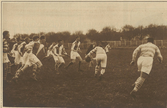
Ein Angriff der Heidelberger Dreiviertel