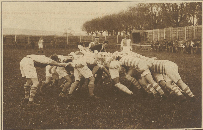
Ein typisches Gedränge