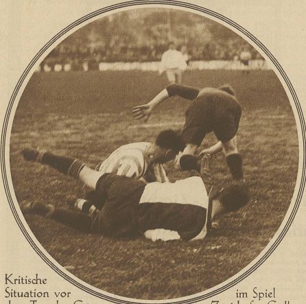
Kritische Situation vor dem Tor der Gäste