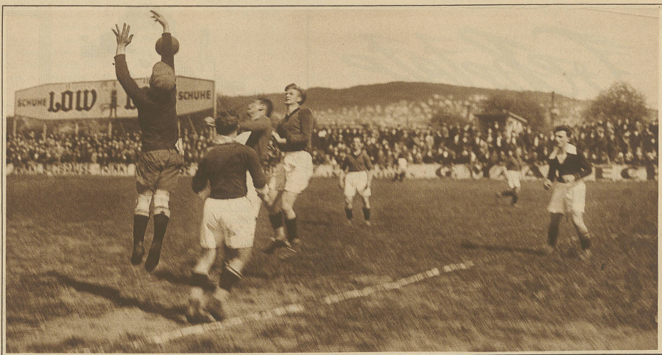
Aus dem Spiel Young Fellows-Lugano 5:3