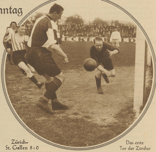
Zürich-St. Gallen 5:0