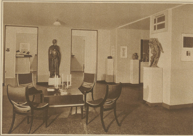
Im Kunstgewerbe-museum der Stadt Zürich ist gegenwärtig eine Schau des neuesten Kunstgewerbes aus der Pariser Ausstellung 1925 zu sehen. Sie umfaßt eine Auswahl der besten Arbeiten aus 9 verschiedenen Staaten. Unser Bild zeigt einen Ausschnitt aus der dänischen Abteilung

Ach Gott, ein Jungeselle! Ein vieldeutiges Aehselzucken, ein mitleidiges Lächeln, das mehr sagt als Worte. Eine Abart des Homo sapiens, umstritten im Urteil der Menge, die Zielscheibe mannigfachen Spottes, der Gegenstand einer gewissen Geringschätzung: das ist der Hagestolz. Man droht dem «hartgesottenen Sünder» mit der Junggesellensteuer. Kein so modernes Schmreckmittel, wie viele glauben. Alles schon dagewesen. Kreislauf der Dinge!