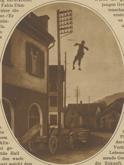
Eine Strohuppe mit dem «Mais-Brief»