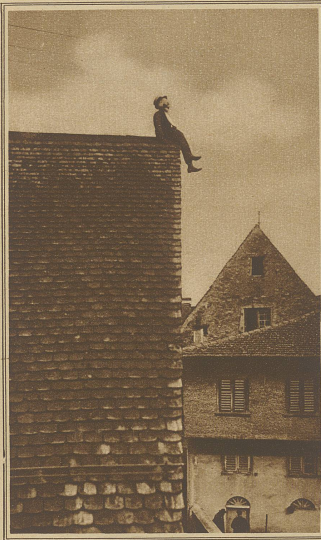
Der «Maia-Ma» auf dem Dachstuhl