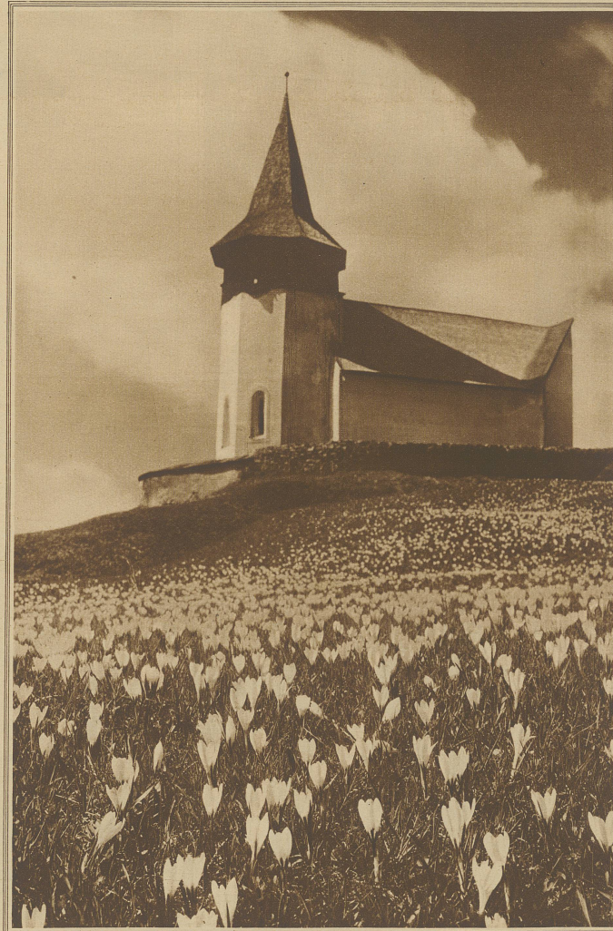
Frühlingserwachen im Hochtal