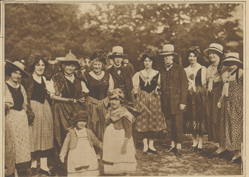
Trachtengruppe aus Waadt, Wallis und Tessin