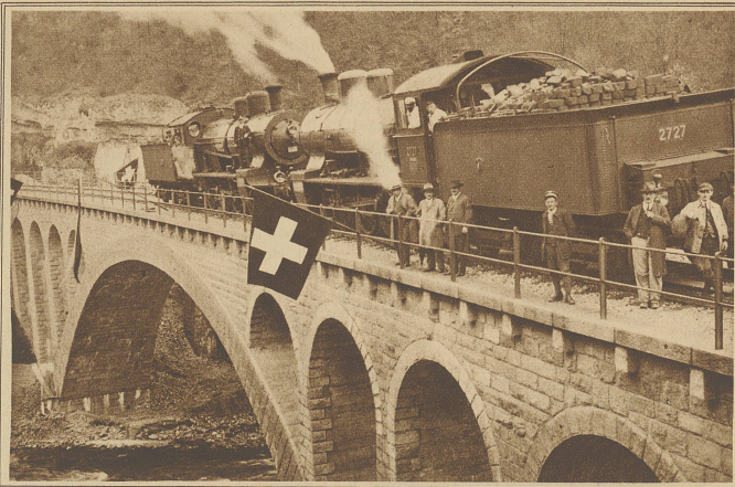
Die untere Brücke während der Belastungsprobe