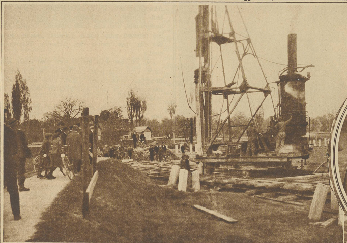
In Altenrhein bei Rorschach erstellen die Dornierwerke auf Schweizergebiet eine große Flugzeugfabrik. Mit dem Bau der riesigen Halle ist schon seit einiger Zeit begonnen worden. Unser Bild zeigt die »Dampfkatze«, die zur Fundamentierung der Halle 16 Meter lange Betonpfähle in den weichen Boden rammt