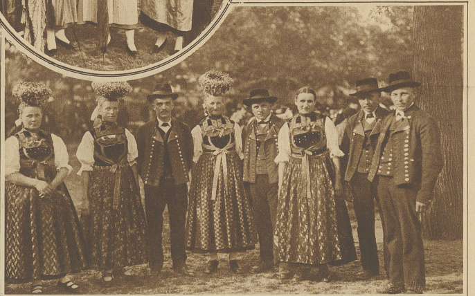
Aus dem Drei-Länder-Trachtenfest in Basel