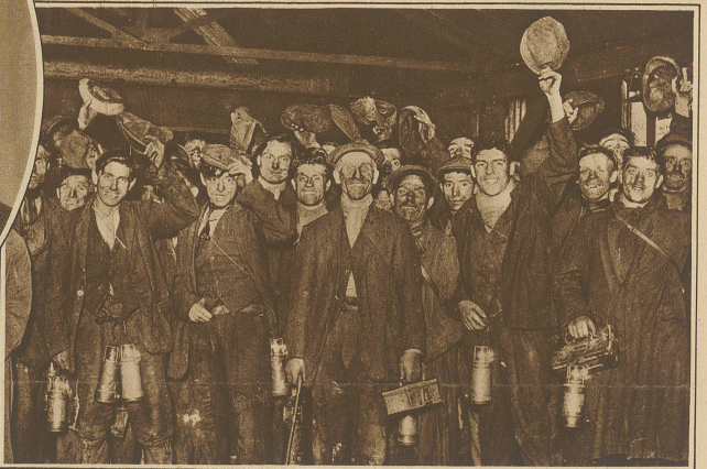
Die letzten Bergleute verlassen die Gruben am Tage des Streikbeginns