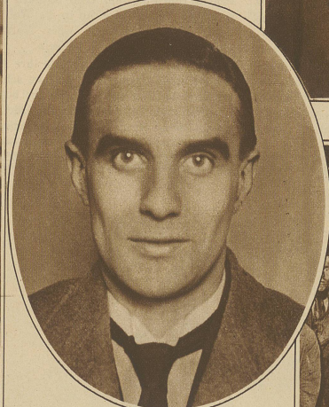
Der englische Kommunistenführer Campbell