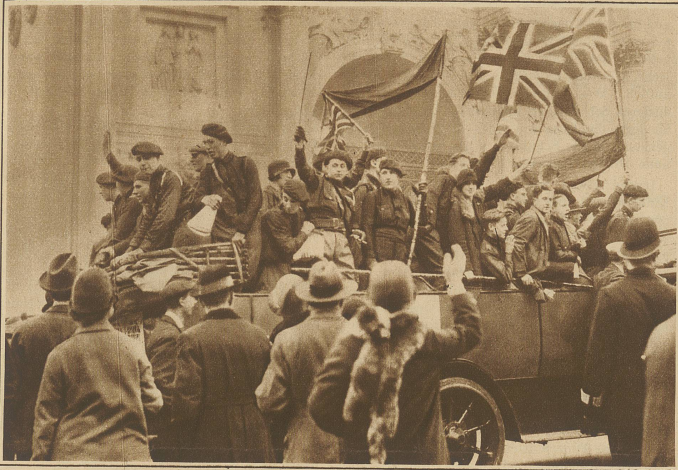
Englische Fascisten auf einem Demonstrationszug zum Hyde Park