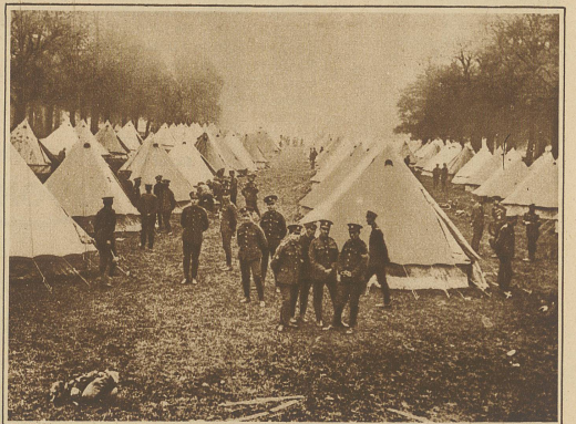
Die Regierung hält das Militär während des Generalstreikes in Bereitschaft. Unsere Aufnahme zeigt ein Lager in Kensington Garden in London