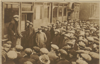
Eine importierte Arbeiterarmee: In den Aufbauphasen der englischen Städte haben sich während der letzten über fünf importierten Vorausarbeiten, bei welchen die Kommission zur Bekämpfung der Arbeitslosigkeit aufbot.