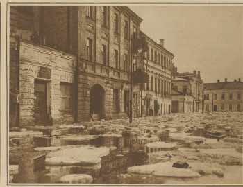
Während der starken Eismeerperiode ist in Russland das Eis der Flüsse in rascher Schmelze und flutet in den Straßen an großen Überschwemmungen. Ein eigenartiges Bild in dem Straßen Moskwa, durch die mit der Eiswasserwanne die Straßen strömen.