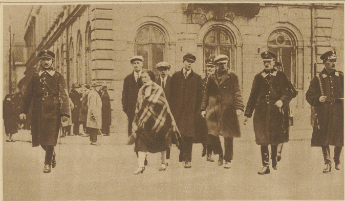
Revolution in Polen.