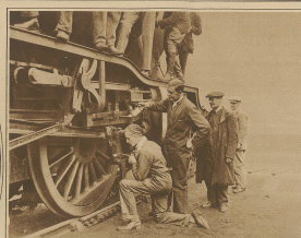
Englische Studenten versuchen Lokomotiv-fahrer- und Heizerdienste auf der Eisenbahn.