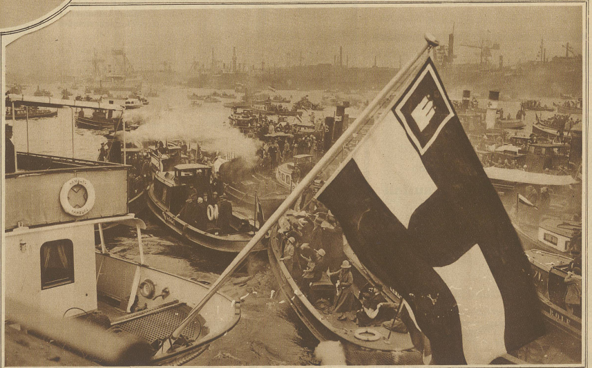
Die Staatsjacht „Hamburg“ mit Reichspräsident von Hindenburg an Bord inmitten des riesigen Getümmels im Hamburger Hafen.