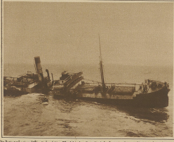
Ein japanisches Schiff mit der letzten Restladung der verbleibenden japanischen Frachter, die im Sommer 1919 nach Japan zurückkehrten.