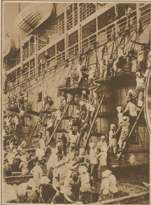
Japanische Frachter als Kohlenlieferanten. Bei der Ausladung von Kohlen der Südsee in japanischen Häfen dienen Frachter von Japan als Kohlenlieferanten.