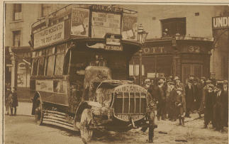
Das Bild zeigt einen von Freiwilligen geführten Autobus, der von Streckkunden in den Straßen Londons ausgehollt und in Flammen gesteckt wurde.