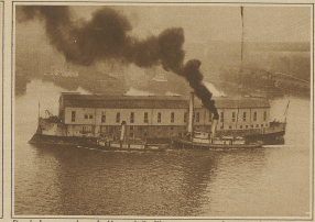
Das frühere amerikanische Kriegsschiff „Albatross“ ist in ein schwimmendes Haus umgewandelt worden und dient heute als Verspannungswerkzeug.