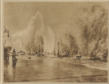
Eine Springflut in Rio de Janeiro. Das Meer trieb hohe Wellen gegen die Promenaden, die, wie im Bild ersichtlich, teilweise eingestürzt wurden.