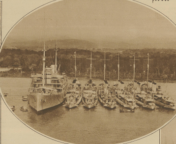
Ein amerikanisches Mutterschiff mit seinen 6 Zerstörern bei Balboa in der Kanalzone.