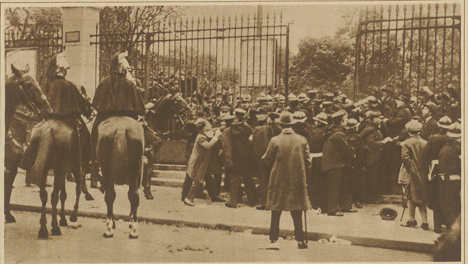
Blutige Jeanne d'Arc-Feier in Paris. Demonstrierende Royalisten werden von der Polizei zurückgedrängt. Die Kämpfe hatten über hundert Verletzte zur Folge.