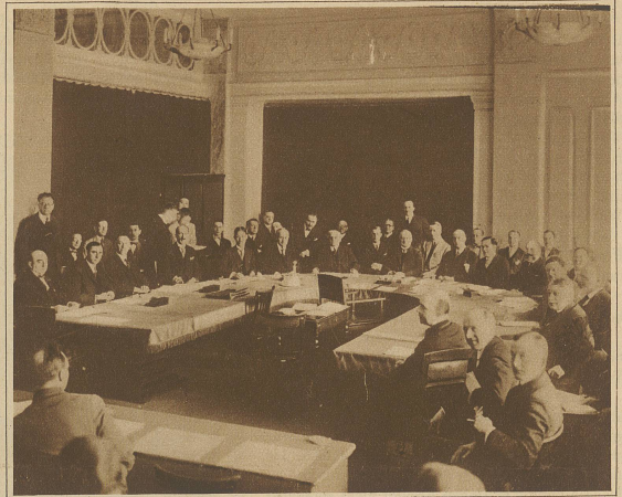
Eine Sitzung der Kommission für die Reorganisation des Völkerbundesrates in Genf. Als Präsident amtiert Bundesrat Motta. Die Kommission ist der Auffassung, daß, außer für Deutschland, keine neuen ständigen Ratssitze zu schaffen seien.