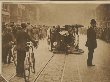
Ein Strassenbild aus der Blüthenzeit Londons: Ein umgeworfener Motor Lastwagen.