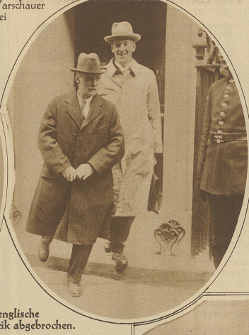
Der englische Generalstreik abgebrochen.