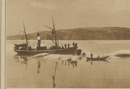
Heimfahrt der Walfischfänger mit ihrer Beute.