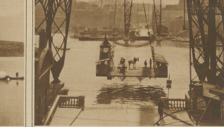
Die große transportierende Brücke im Hafenviertel von Marseille. Seemannschaft der Brücke mit der schwebenden Fahre.