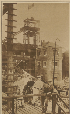
Bild in ein von zwei britischen Kohlenbergwerken, von nur noch einige Festungslager die verbleibenden Kohlen zu gewinnen.