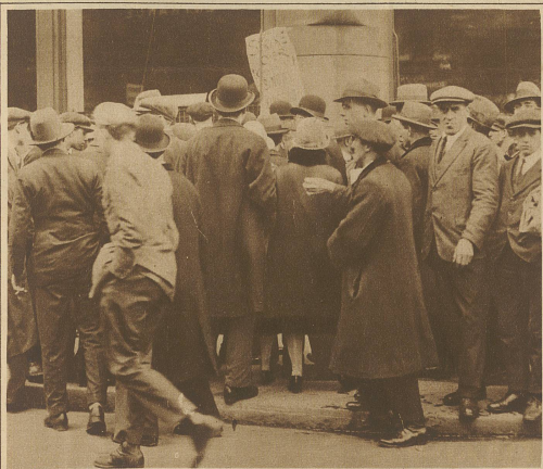
Zum Abbruch des englischen Generalstreiks. Die Bevölkerung drängt sich um die den Streikabbruch ankündigenden Plakate.