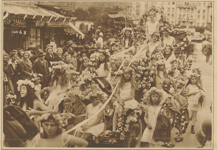
Ein reizender Blumenwagen