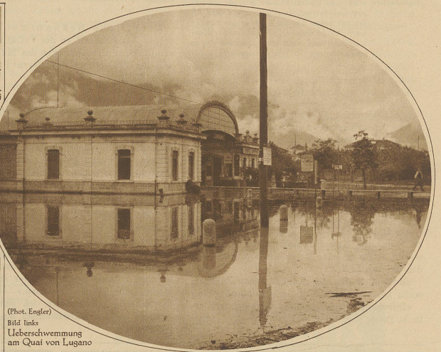
Bild links Ueberschwemmung am Quai von Lugano