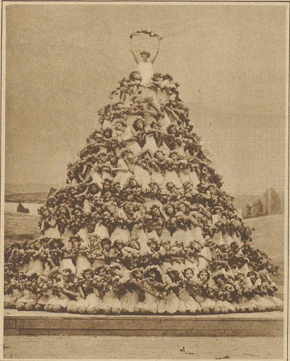
Aus dem Festspiel: «Segen der Arbeit»