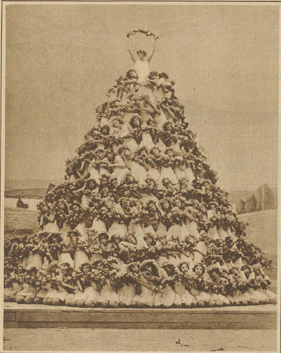
Aus dem Festspiel: «Segen der Arbeit»