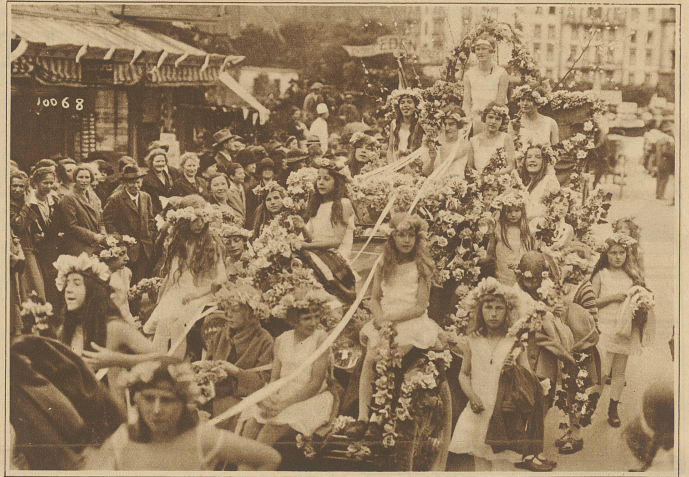
Ein reizender Blumenwagen