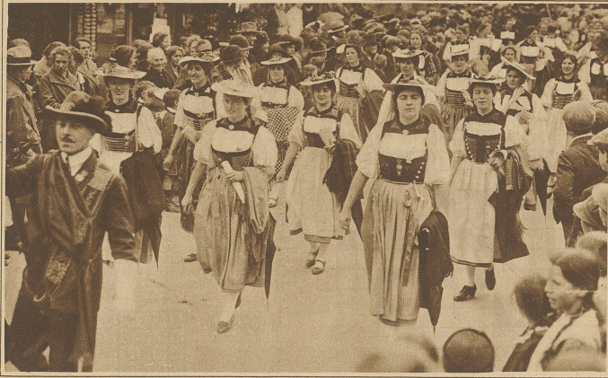
Trachtengruppe aus dem Festzuge