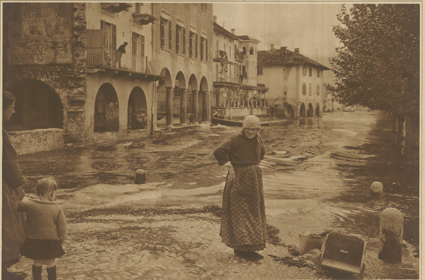
Die Wellen des Lago Maggiore überfluten den am See gelegenen Dorfteil von Ascona