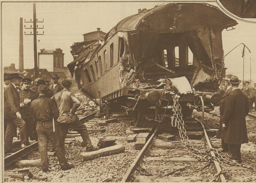
Der drittletzte Wagen des verunglückten Rosenheimer Zuges