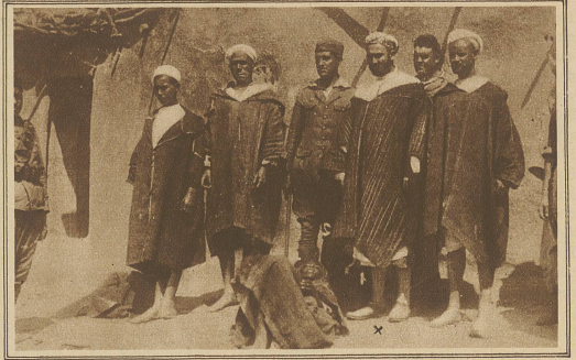
Abd el Krim kapituliert. Gelangene Ryfkablenführer erwarten ihren Abtransport. In der Mitte (X) ein Vetter Abd el Krims