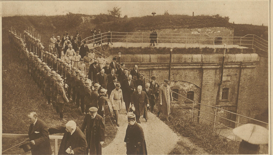
Zur Reise des französischen Präsidenten nach Metz. Doumergue besucht das Fort St-Quentin