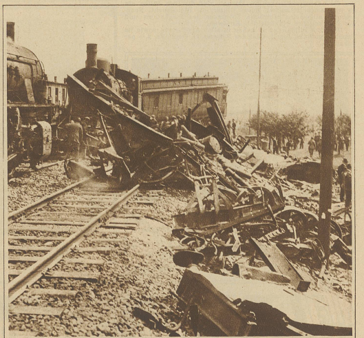
Blick auf die Unglücksstelle am Morgen nach der Katastrophe