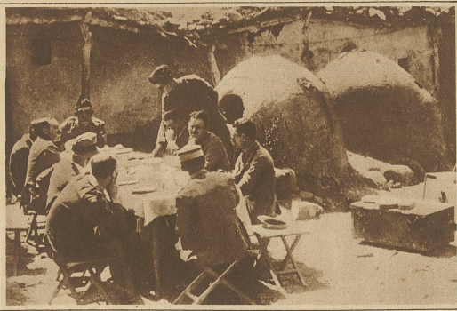
Das Ende des Marokkokrieges. Der Stab einer spanischen Abteilung im ehemaligen Hauptquartier Abd el Krims