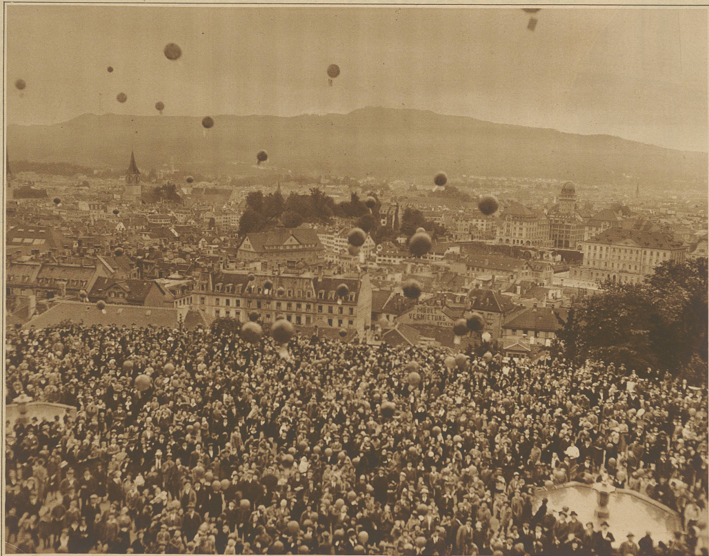
Start zum letzten vom Globus veranstalteten Kinderballon-Wettfliegen auf der Poly-Terrasse in Zürich