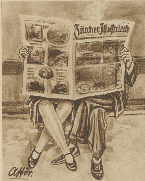
Gescht Schaggi, 's Format vo d'r Zürcher Illustrierte isch halt glüch no praktisch

Auf Posten. Der General will sich von der Kenntnis der Obliegenheiten des Postens bei einem Pulvermagazin überzeugen und sucht den Mann auf. Er fragt ihn: «Was würden Sie tun, wenn ich mit einer brennenden Zigarre in Ihre Nähe käme?» — «Ich würden den Herrn General ersuchen wegzugehen, weil es nicht erlaubt ist, in der Nähe des Pulvermagazins zu rauchen.» — «Ich gehe trotzdem nicht weg.» — «Dann würde ich den Herrn General noch einmal ersuchen wegzugehen.» — «Ich gehe aber noch immer nicht weg; was würden Sie dann