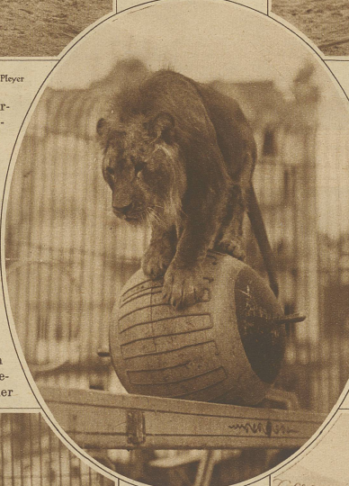
Ein Löwe auf der rotierenden Kugel

Raubtierzucht und Gewaltanwendung sind für die meisten unzertrennlich verbundene Begriffe. Daß es aber auch ohne Gewaltmittel, lediglich durch gute, liebevolle Behandlung möglich ist, das erforderliche vertrauensvolle Verhältnis zwischen Bändiger und Tier herzustellen, glaube ich in meiner mehr als zwanzigjährigen Tätigkeit bewiesen zu haben. / Von jeher habe ich es verabscheut, mit eisernen Gabeln und Stangen oder gar mit unsinnigen Schließ-eisen den Tieren die Courage abzukaufen, von dem Standpunkte ausgehend, daß auch ein Raubtier und mag es als noch so gefährlich verschrien sein, eine Seele und gewiß auch einen Charakter hat. Allerdings hat es Exemplare darunter, sogenannte «Verbrecher», mit denen man ab und zu etwas unsanft verfahren muß; dazu genügt aber auch die Peitsche. / Allerdings hat es früher Dresseure gegeben und gibt es leider auch heute noch, welche die Tiere mit glühenden Gabeln, spitzen Stacheln und ähnlichen Instrumenten bearbeiten. Diese Leute aber verdienen meiner Ansicht nach das Schicksal, das sie früher oder später meistens erreicht: nämlich von einem gereizten Tiere angegriffen, schwer verwundet oder gar getötet zu werden. / Wie die Dresseure, so teilen sich auch die Zuschauer