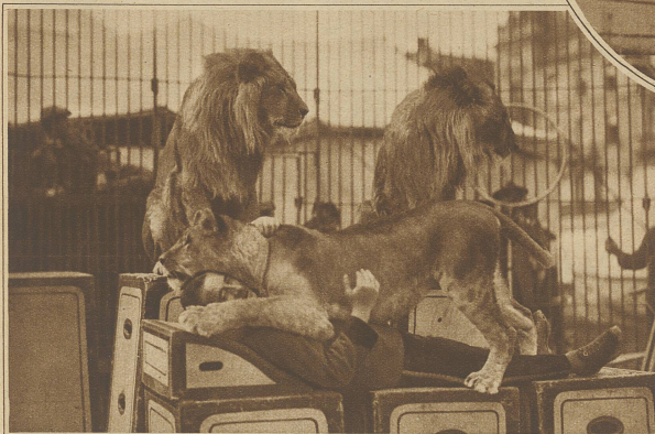
In ungemütlicher Gesellschaft

meist in zwei Parteien. Die einen sehen gerne eine Raubtierdressur, bei der es ruhig und ohne Tantom zugeht; die andern möchten gerne, daß der Dompteur angesprochen, verletzt und womöglich gar aufgefressen wird. Solchen Zuschauern möchte ich aber empfehlen, doch lieber in einen Kino zu gehen und sich dort einen Film anzusehen, in dem es recht «grausig» zugeht; dort kommen sie dann eher auf ihre Rechnung. / Man fragt mich oft: wie ist es denn möglich, aus einem Löwen ein «Schaf» zu machen? Dazu gehört nun vor allem, daß man den Instinkt und den Charakter der Tiere genau studiert haben muß. Neigt nun ein Tier zur Falschheit, so zeige ich ihm eben, daß mein Wille stärker ist; immer wieder versuche ich, mit Liebe und guter Behandlung dem Tiere beizubringen, daß nichts Unmögliches von ihm verlangt wird. Dazu gehört Geduld, Geduld und immer wieder Geduld. Bisher habe ich mit dieser meiner Methode noch stets gute Erfahrungen gemacht und Glück gehabt. Als ich zum ersten Male zu meinen jetzigen Tieren kam, wollten sie mich auch alle nehmen, jedoch durch Ruhe und Geduld habe ich erreicht, daß ich heute ungeniert mit ihnen zusammenschlafen könnte, einen einzigen Löwen ausgenommen, er ist eben ein Unverbesserlicher; es gibt aber auch unter Menschen solche.