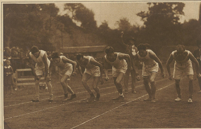
Start zum 800m-Lauf