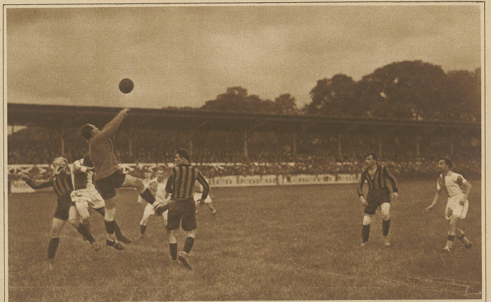
Pulver wehrt eine hohe Flanke