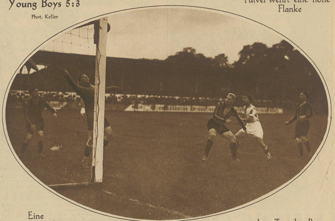
Eine gefährliche Situation