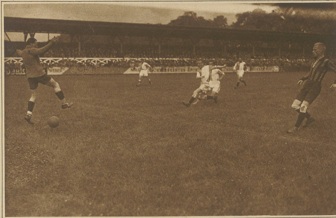
Eine verunglückte Abwehr