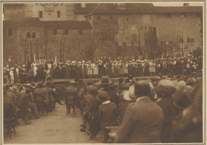
Zwei Bilder aus dem von Dr. E. Flückiger verfaßten Festspiel aus der Zeit der Murten Schlacht