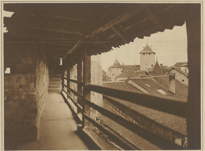
Murten, Stadtmauer mit Wehrgang