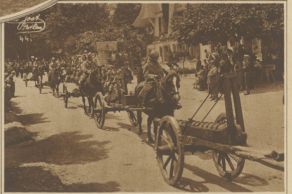
Neuenstadt. 6 Geschütze aus der Schlacht bei Murten

als gegen 9 eine letzte, Uhrmorgens gewaltsame der große Erkundung Kriegsrat des Feindes der Schweizer durch die Verbündeten Hauptleute erfolgen. Als jede Abteilung ordnete ihre Hauptleute und Räte dazu ab, getroffen waren, schied Herter die Vorhut aus, nämlich die