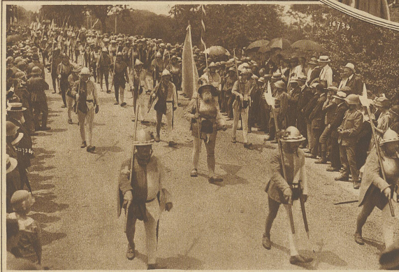
Das Luzerner Banner im historischen Festzuge

Nun folgen sich die Ereignisse so rasch, daß man Mühe hat zu folgen: kurz nach Mittag gerieten die Heere beim Grünhag ins Handgemenge, nachdem die erste Salve den Eidgenossen etliche Verluste beigebracht hatte. Hier stockte der Kampf einige Zeit, bis eine Umgehung der Schwyz und das Eingreifen des Gewaltthausens die Entscheidung brachte; der Hag wurde überbrannt, die Geschütze genommen und umgedreht, die Büchsenmeister und die Feldwachen, etwa 2-3000 Mann niedergemacht. In breiten, tiefgegliederten Vierecken wälzten sich nun die Angreifer gegen die burgundische Wagenburg, gegen das Lager rechts und links vom Ziegerli oder dem Grand Bois-Domingue zu; um 1 Uhr dürfte hier der Kampf entbrannt sein, aber schon war die Entscheidung nicht mehr zweifelhaft, denn die festgeschlossenen Haufen der Schweizer brachen jeden Widerstand, zersplitterten mit ihren Speißen Reitergeschwader, zerrissen mit den Halparten Wagenburgen und