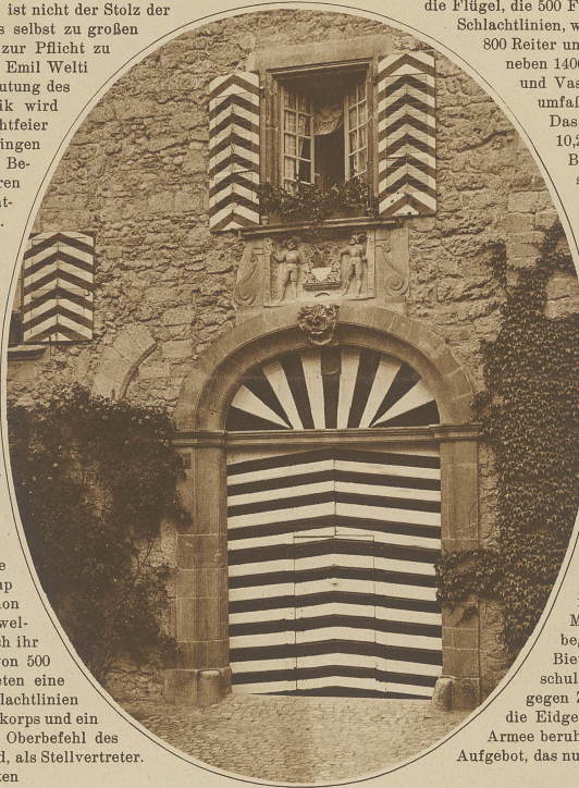
Der prächtige Torcingang