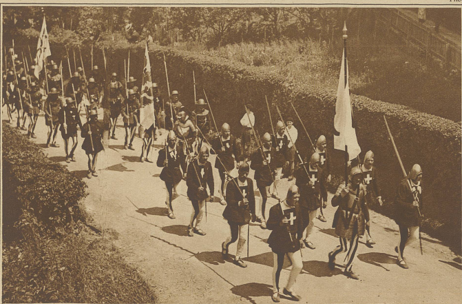
Banner aus dem Kanton Aargau