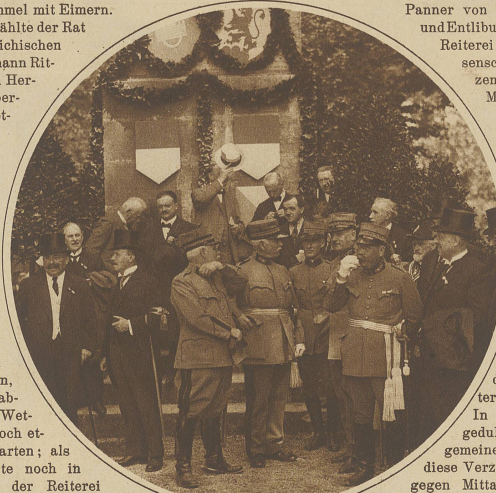
Das Ehrenkomitee und die Vertreter