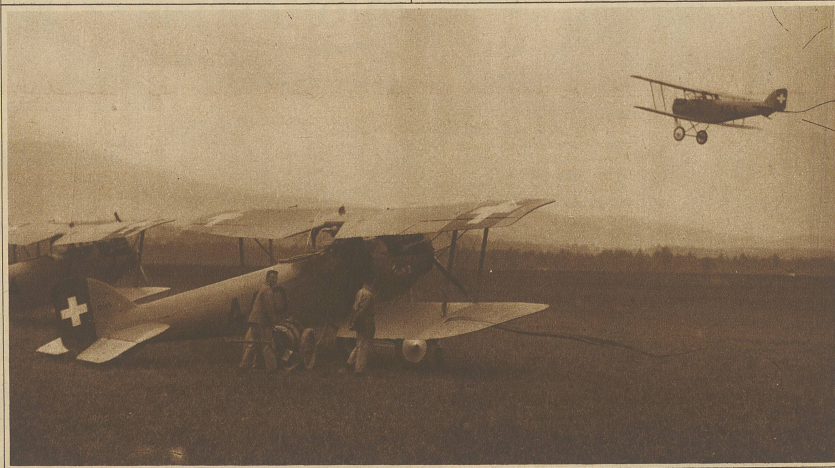
STAFETTENFLUG DER MILITARFLIEGER IN THUN