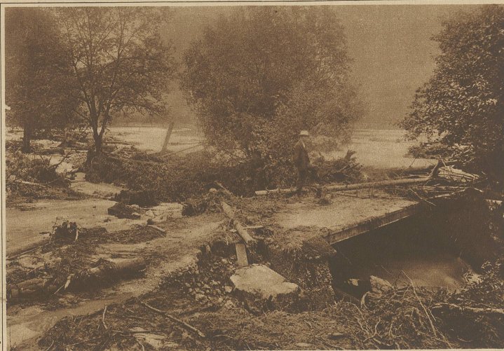
in Balsthal Die Verheerungen des Augstbaches oberhalb Balsthal