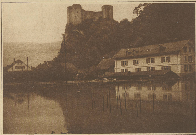
Die weite überschwemmte Fläche beim Schloß Klaus