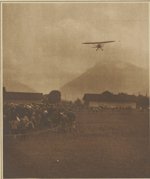
Landung in Thun nach dem ersten Rundflug Thun-Basel-Genf