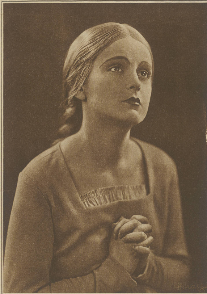
Kein Filmstar, sondern ein Mädchen aus dem Volke: CAMILLA HORN spielt die Rolle des Gretchens im neuen Großfilm «Faust»

sich fertig und stieg durch das sonnenüberleuchtete Treppenhaus hinunter, völlig befreit wieder und völlig sicher.