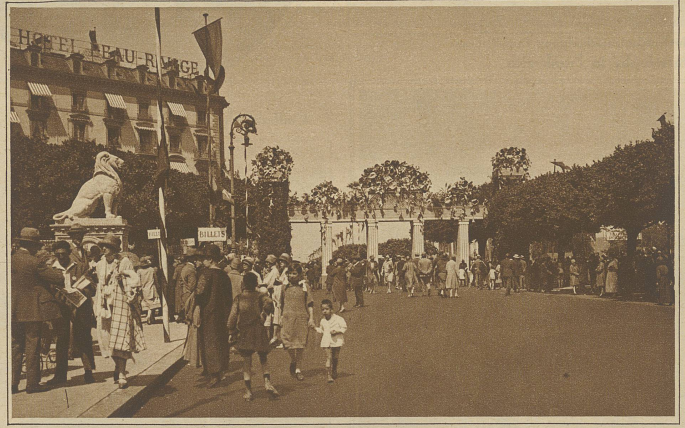
Der blumengeschmückte Bogen am Eingang zu den Quaianlagen

Ein Abendhauch kam über den Platz daher. Plötzlich fror sie in ihrem knappen Kostüm aus weicher Wolle. Sie vergrub die Hände in ihren leeren kleinen Muff. Dann atmete sie tief auf, so daß fast ein Seufzer daraus wurde, und ging rasch davon, wo sie die innere Stadt vermutete.