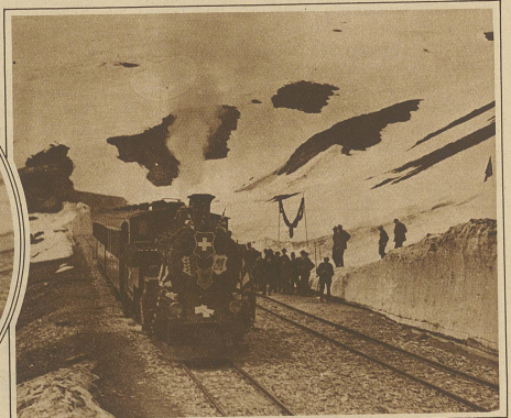
Ankunft des Sonderzuges auf der Urner Seite der Furka