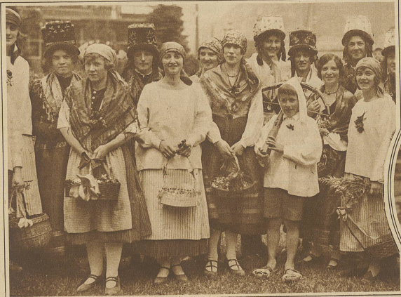
Trachtengruppen aus den Kantonen Wallis und Uri bei der Begrüßung in Andermatt