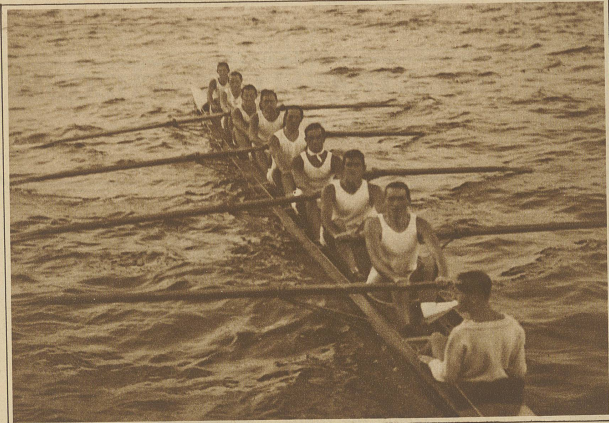
Der siegreiche Achter der Rudersektion des F.C. Zürich