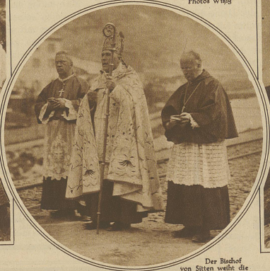
Der Bischof von Sitten weiht die Bahn auf der Station Gletsch