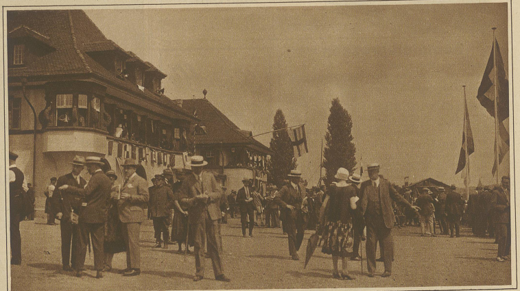
Buntes Leben am Ziel vor den Bootshäusern Internationale Ruder-Regatta in Zürich