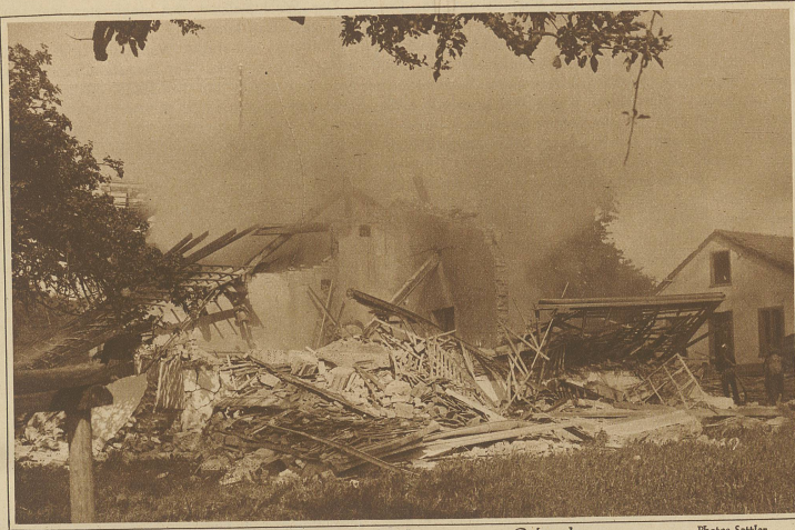
Die erste Aufnahme des zerstörten Gebäudes