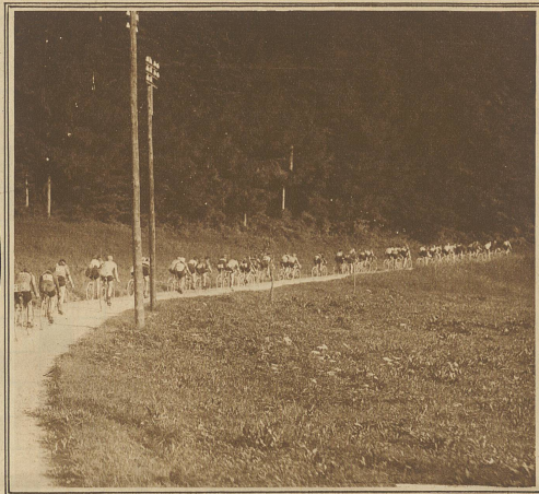
Die Kopfgruppe der Amateur-Senioren vor Bern