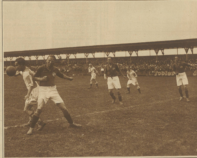
Servette schlägt Grasshoppers 3:2 u. wird Schweizer Meister