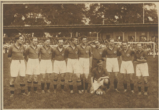
Die Meistermannschaft des F. C. Servette, Genf