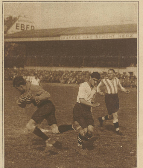
Hofmann fängt eine scharfe Flanke