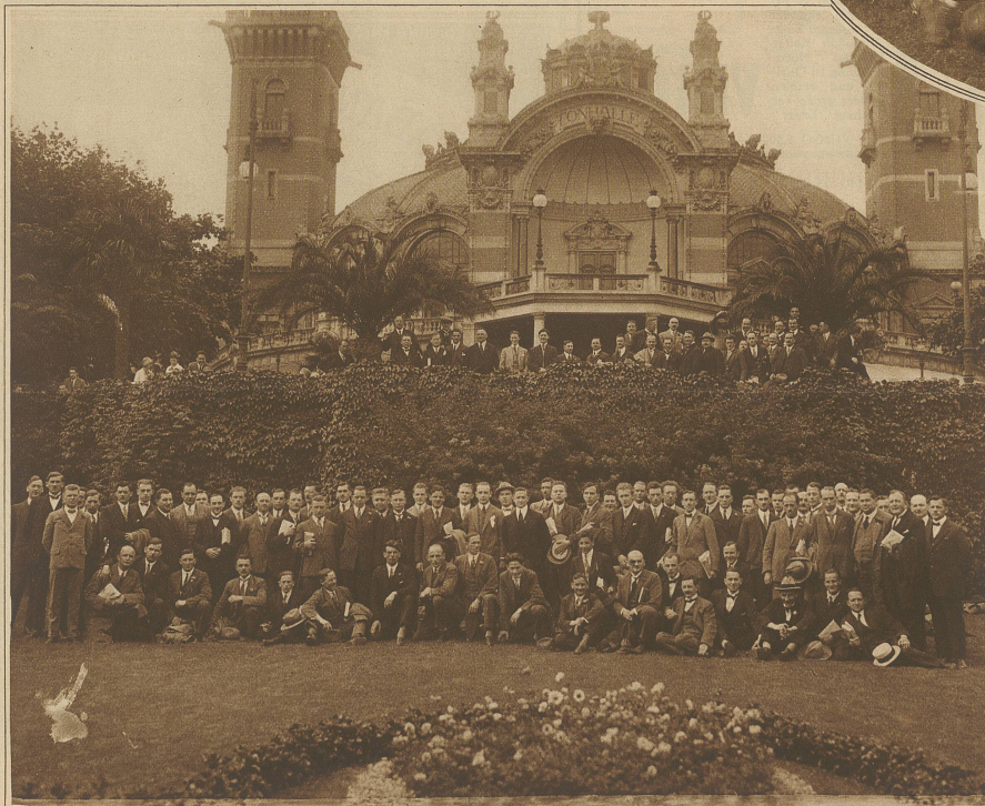
Jubiläums-Delegiertenversammlung des Schweiz. Fußball- u. Athletik-Verbandes. Die Delegierten vor der Zürcher Tonhalle