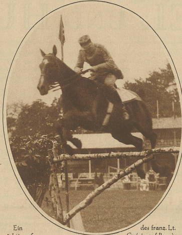
Ein prächtiger Sprung