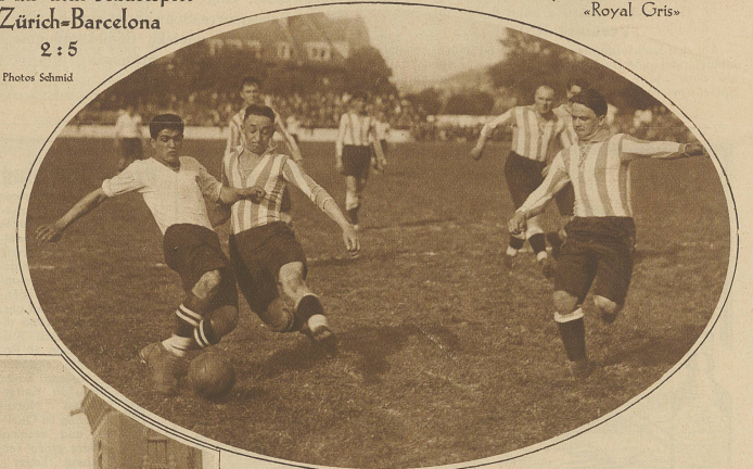
Prächtige Kampfsituation vor dem Tore der Zürcher