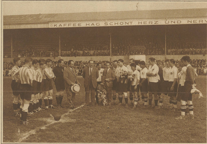
Begrüßung der beiden Mannschaften