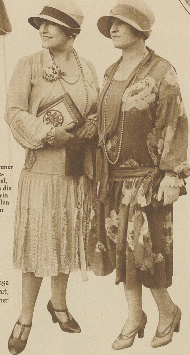
Das elegante, großblumige Chiffon-Kleid

gemacht! Es wird nötig sein, daß die Mode für solche Wetterabnormitäten neue, originelle Einfälle bereit hält. Denn wir wollen und sollen auch unter drückendster Wolkenlast chic und geschmackvoll sein, was sich mit Zweckmäßigkeit sehr wohl vereinen läßt. Die heliotrop- und lavendellarbigen imprägnierten Regenmäntel sind ein willkommener Schritt vorwärts in dieser Richtung. Vielleicht gelingt es ihnen, dem Himmel ein Lächeln abzurufen über diesen kindlichen Versuch, des Sommers Farben bei Sturm und Regen spazieren zu führen.