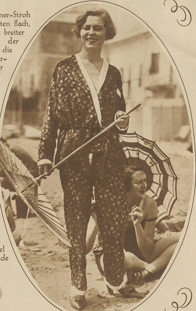
An sonnigen Gestaden Eine Bade-Schönheit in ihrem aparten Strand-Pyjama

Trotz! Manila, Roßhaar und Florentiner-Stroh sind bevorzugt. Der neue Hut ist hinten flach, an den Seiten aber weit ausladend, mit breiter Vorderkrempe, die das Gesichtchen der Schönen geheimnisvoll beschattet und die Augen noch verführerischer darunter hervorblicken läßt. Farbiger oder schwarzer Samt weich um den ziemlich hohen Kopf geschlungen, die Krempe von dem gleichen Material umrandet, hier und da versuchsweise ein Blumentuff, ergibt geschmackvolle Modelle. Können wir aber den kleinen Hut nun entbehren? Keineswegs! Von dem Begriff des ausrasierten Nackens wird das knappe, schmalrandige Hütchen, sei es aus Filz, sei es aus der so modernen sommerlichen Häckelarbeit hergestellt, nicht mehr zu trennen sein. Keck und fesch auf den rassistigen Kopf gedrückt, ist und bleibt es der Liebling der Damen nach wie vor. Der große Hut ist der Nachmittag- und Abendtoilette reserviert. Der kleine Hut dem Shopping am Vormittag, der Morgenpromenade, dem Trotteur oder Mantel. / Ach, den Mantel hat uns der regenspendende Himmel in diesem Sommer so recht zum Freunde