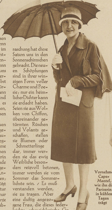
Vornehmer Cape-Mantel, wie ihn die Pariserin in kühlen Tagen trägt

raschung hat diese Saison uns in den Sonnenschirmchen gebracht. Die neuen Schöpfungen sind in ihrer winzigen Form voller Charme und Poesie, nur ein heimlicher Dichter kann sie erdacht haben. Seien sie aus Wolken von Chiffon, übereinander getürmten Rüschen und Volants geschaffen, stellen sie Blumen oder Schmetterlinge dar, immer werden sie das ewig Weibliche besonders reizvoll betonen, immer werden sie vom Sommer das Sommerlichste sein. / Es muß verstanden werden, sie zu tragen. Aber eine duftig angezogene Frau, die dieses federleichte, schmeichlerische Gebilde wie einen Blumenstrauß lässig-graziös im Arm zu tragen oder sich spielerisch damit zu beschatten weiß, wird ihres Erfolges sicher sein. Die Damen sollten sich solche Gelegenheit der Mode, die der weiblichen Anmut weitesten Spielraum läßt, nicht entgehen lassen. Die kluge Frau weiß, daß sie nie aufhören darf, zu gefallen, daß sie immer wieder neu und reizvoll erscheinen muß.