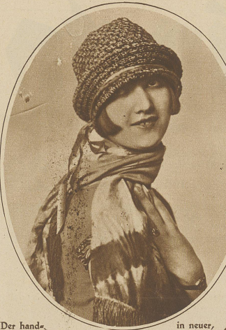
Der hand-geschaltete Hut

das Cape bringt, das nach der Mode nur kurz sein darf, gerade den Rücken bis zu den Schultern verhüllt und immer zum Badekostüm