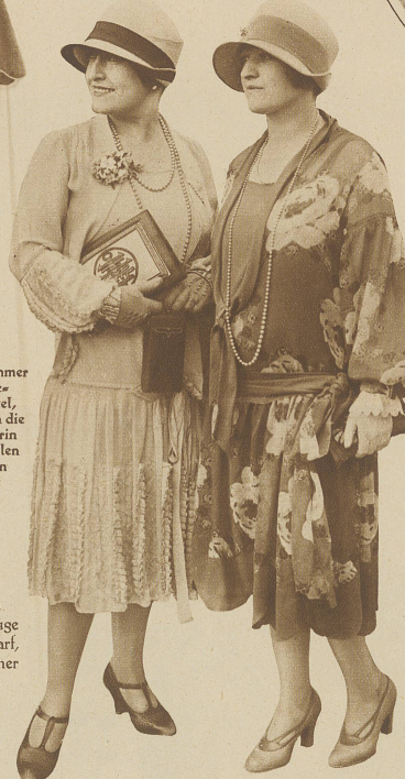
Das elegante, großblumige Chiffon-Kleid

gemacht! Es wird nötig sein, daß die Mode für solche Wetterabnormitäten neue, originelle Einfälle bereit hält. Denn wir wollen und sollen auch unter drückendster Wolkenlast chic und geschmackvoll sein, was sich mit Zweckmäßigkeit sehr wohl vereinen läßt. Die heliotrop- und lavendellarbigen imprägnierten Regenmäntel sind ein willkommener Schritt vorwärts in dieser Richtung. Vielleicht gelingt es ihnen, dem Himmel ein Lächeln abzurufen über diesen kindlichen Versuch, des Sommers Farben bei Sturm und Regen spazieren zu führen.