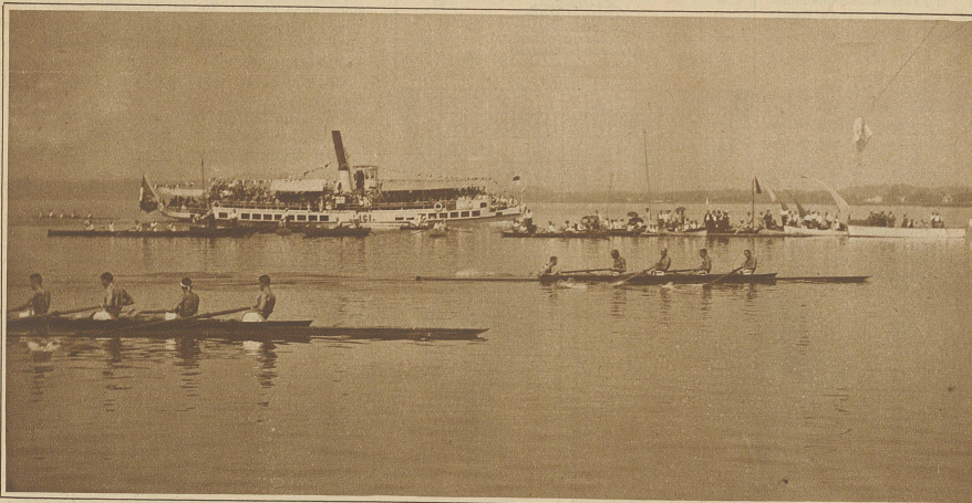
Club Biel gewinnt die Meisterschaft im Vierer m. St.