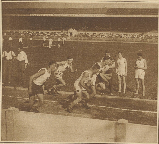
Start zum 3000 Meter-Lauf