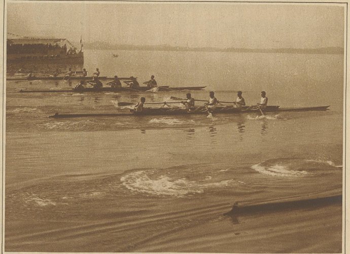
Start der Vierer Outriggers mit St., Junioren