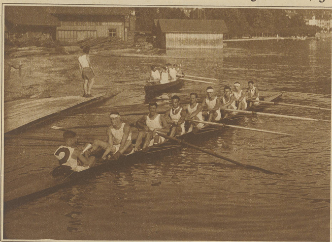
Der siegreiche Meisterschafts-Achter der Rudersektion F. C. Zürich