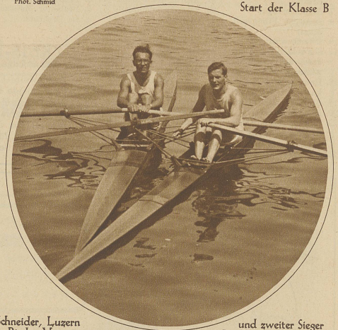
Schneider, Luzern u. Rieder, Vevey, erster