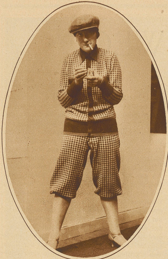
Herr oder Dame?

Die Frage scheint in Anbetracht der absoluten Vermännlichung des Aeußern nicht unberechtigt