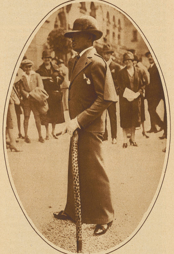
Der schwarze Gentleman steht bei den Damen, derart hoch im Kurs, daß er es ruhig wagen darf, ihnen auf dem Gebiet der Mode Konkurrenz zu machen

Gruppe bemerkenswerter Toiletten auf dem Rennplatz von Longchamp