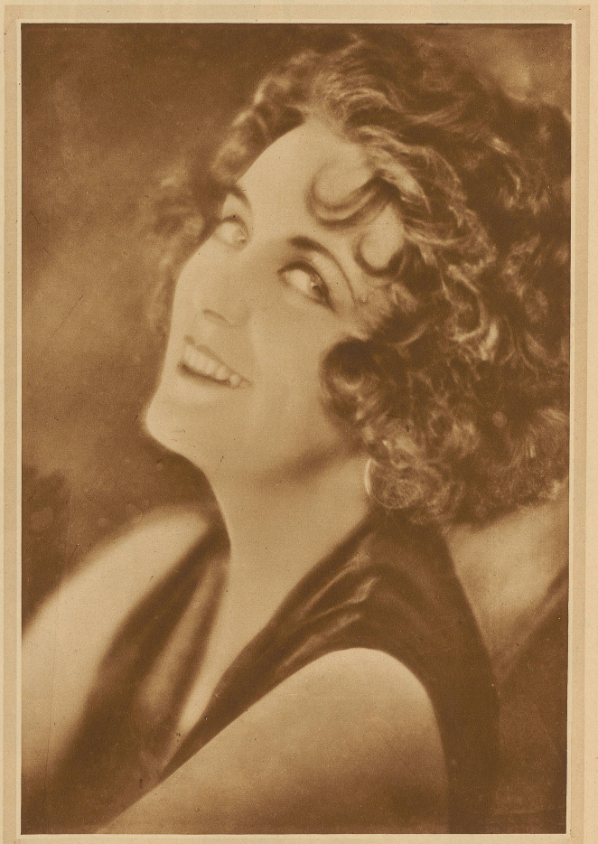
EIN KLEINER SCHELM

Wie ähnlich sah Amadeus in diesem Augenblick seinem Vater! Isolde hatte den Professor kurz vor seinem Tode kennengelernt. So schwächlich, mit solchem Künstlerkopf, mit diesem durchgeistigten Gesicht, so hatte sie den großen Gelehrten im Gedächtnis. Nicht anders mochte Johannes Anselmi mit vierzig Jahren ausgesehen haben, bevor er durch seine ungeheure Erfindung sich und seinen einzigen Nachkommen zu Trägern eines der berühmtesten Namen der Erde gemacht hatte.