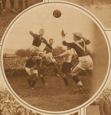
Endlich haben auch die Schweizer ein Tor geschossen Nebstehend: Letzte Ablösung der ersten Mannschaft des F. C. Z.