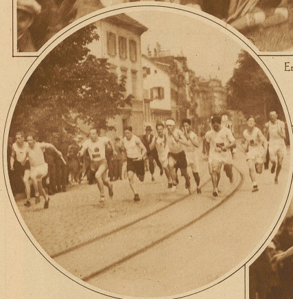
Die Läufer der Kategorie B nach dem Start Zürcher Pferderennen