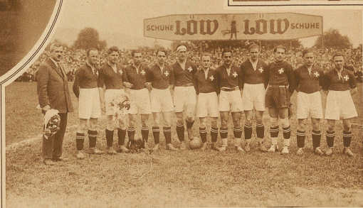
Länder spiel Schweiz-Oesterreich 1:4 Untenstehend: Die Schweizer Nationalmannschaft