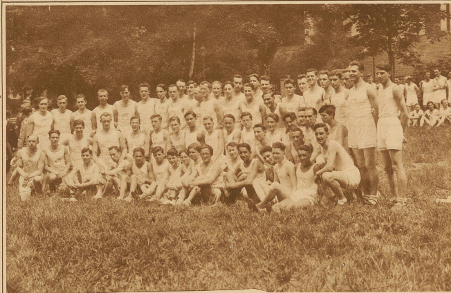
Die Mannschaften des F. C. Zürich, die in Kategorie A und B siegreich blieben