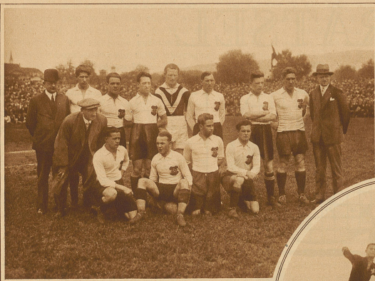
Die siegreiche Mannschaft Oesterreichs