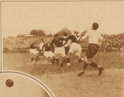
Die Forwards der Schweizer im Kampf mit der Gästeverteidigung Im Kreis: Interessanter Kampfmoment vor dem Tor der Wiener