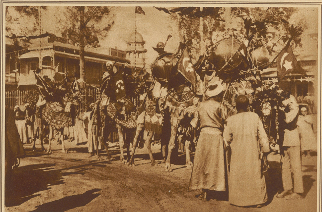
Kesselpauken auf geschmückten Kamelen. Diese Pauken werden nur bei besonderen festlichen Anlässen verwendet