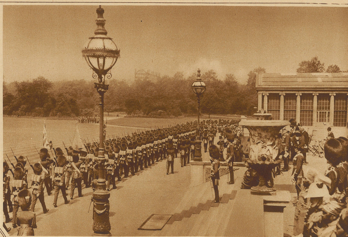
Der englische König und der Prinz von Wales nehmen eine Parade neuuniformierter irischer Gardisten ab