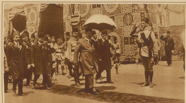
König Fuad von Aegypten mit dem Sonnenschirm. Im Hintergrund ein Prunkzelt der Oasenniederlassung Fayum in Oberägypten