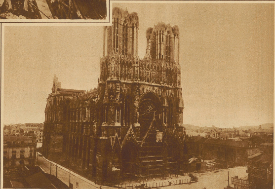
Bild rechts: Generalansicht der wiederhergestellten Kathedrale von Reims, in welcher am Aufahrtstage leierlich der erste Gottesdienst seit dem Weltkrieg abgehalten wurde