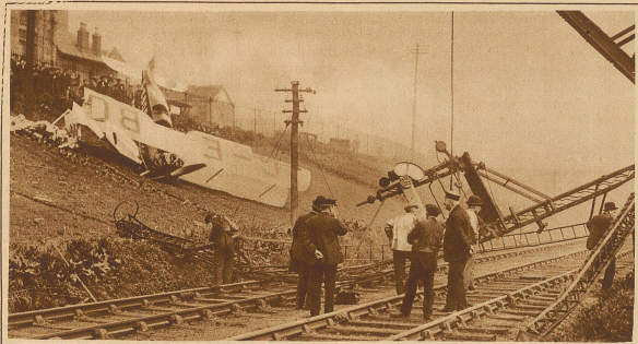
Die Gewalt der Flugzeuge. Daß die Flugzeuge trotz ihrer leichten Konstruktion im Fluge gewaltige Kraft entwickeln können, beweisen die in unserem Bilde dargestellten zertrümmerten Signalmasten der Eisenbahn, die bei einer Notlandung des englischen Militärpiloten Falla bei Glasgow gebrochen wurden. Der Flieger kam mit leichten Verletzungen davon