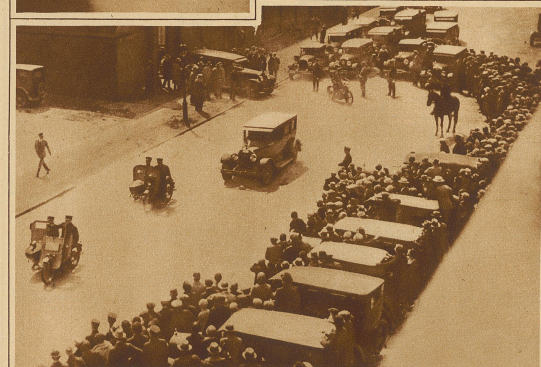
Transport der zum Tode verurteilten Mrs. Ruth Snyder und ihres Geliebten Gray, deren Bilder wir in Nr. 21 veröffentlichten, in das Gefängnis von Sing-Sing. Man beachte die den Transport begleitenden Panzermotorräder der Polizei