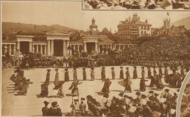
Opfertanz der Bacchantinnen