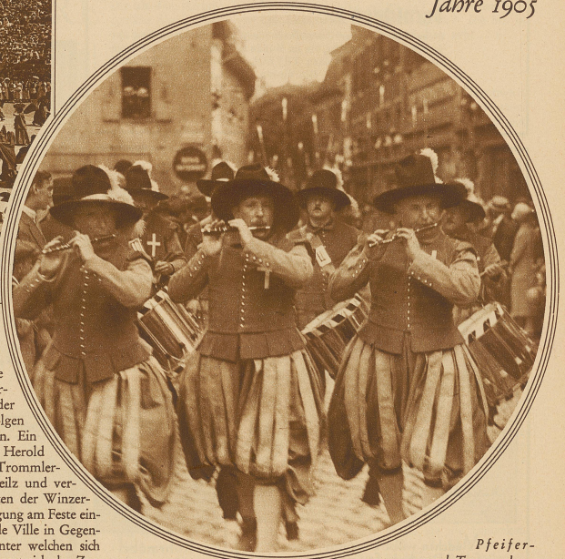
Pfeifer- und Trommlergruppe anlässlich der «Publication» vom letzten Sonntag