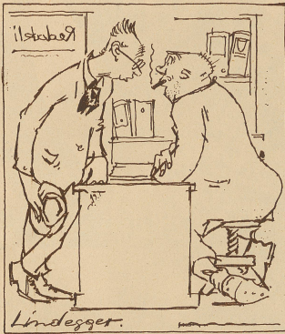
Schriftsteller: «Gestern stand in Ihrem Blatt meine Todesanzeige — vergüten Sie mich — oder widerrufen sie's? — « — das gibt's nicht — aber ich kann Sie für Morgen in den Geburten eintragen — das kostet 5 Franken.»

Im Zoologischen. Der kleine Max im Zoologischen Garten vor dem Elefanten: «Vati, sind das die Tiere, die man aus Mücken macht?»