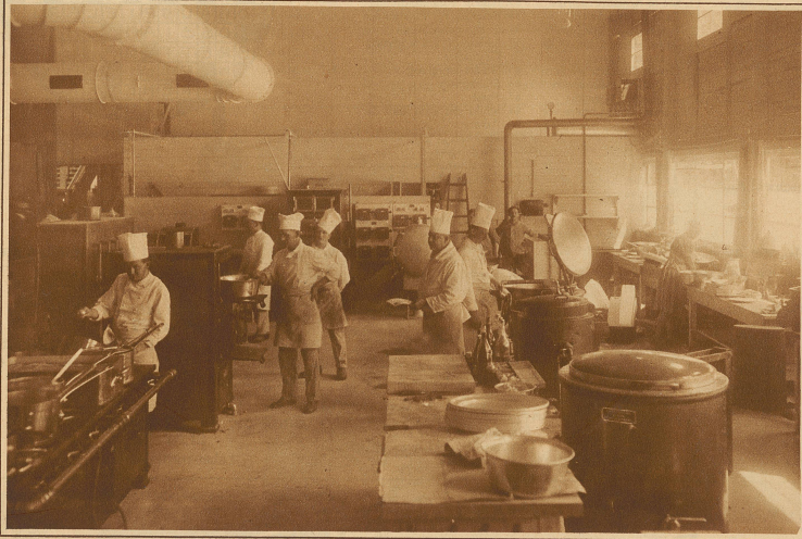
Blick in die Musterküche