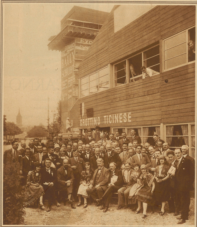
Teilnehmergruppe am Pressetag