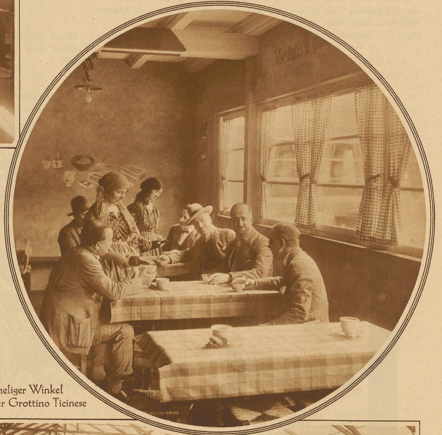
Heimlicher Winkel in der Grotto Ticinese