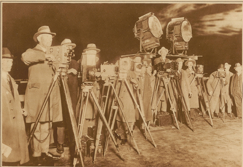
Kino-Operateure und Photographen mit Scheinwerfern warten auf die Landung der Flieger