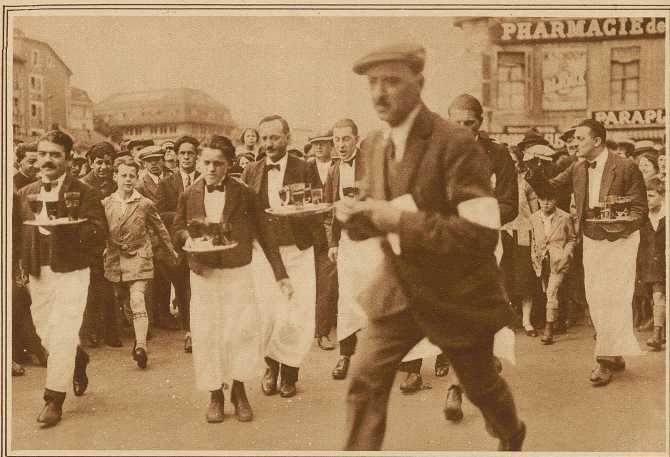
Ein originelles Wettrennen wurde letzten Sonntag von einer Anzahl Kellner in Genf bestritten. Es galt mit einem servierplateau gefüllter Gläser in möglichst kurzer Zeit eine 2,8 km lange Strecke durch die Stadt zurückzulegen. Unser Bild zeigt einen Moment aus dem Rennen, das vom Publikum natürlich mit größtem Interesse verfolgt wurde.