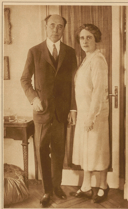
Der bekannte Musiker und Komponist Felix Weingartner mit Gemahlin in seinem neuen Heim in Basel.