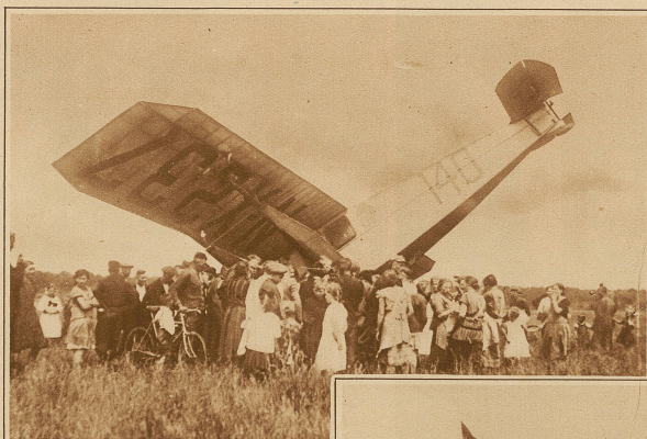
Chamberlins «Columbia»-Maschine, die bei der Notlandung in Kottbus einen «Kopfstand» vollführte, wobei der Propeller zertrümmert wurde