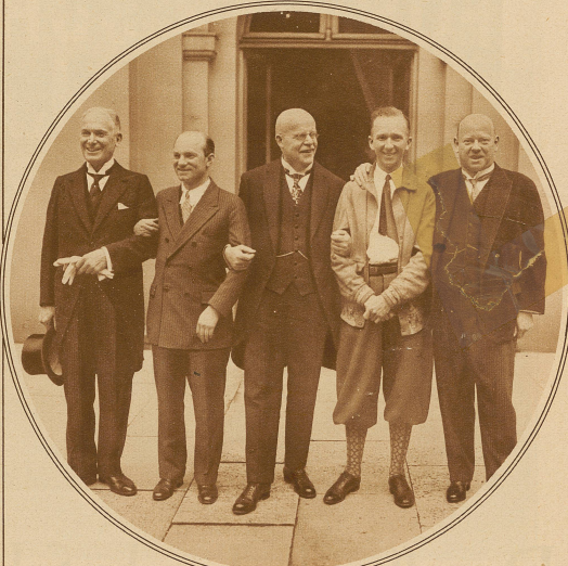
Der Empfang beim deutschen Reichskanzler. Von links nach rechts: Schurman, der amerikanische Botschafter, Chamberlins Begleiter Levine, Reichskanzler Marx, Chamberlin und Außenminister Stresemann