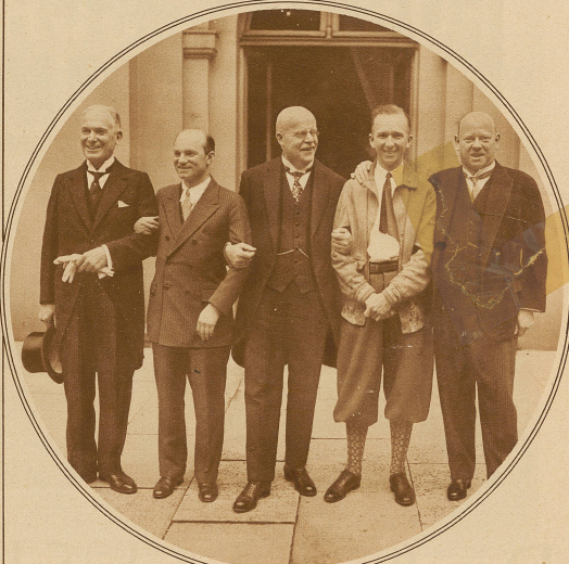
Der Empfang beim deutschen Reichskanzler. Von links nach rechts: Schurman, der amerikanische Botschafter, Chamberlins Begleiter Levine, Reichskanzler Marx, Chamberlin und Außenminister Stresemann