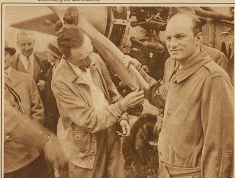
Chamberlins Flug New York – Berlin