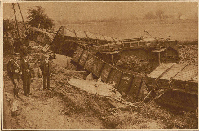
Aus dem Geleise geworfene Güterwagen