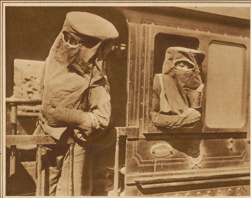
Sicherheitsmasken für Lokomotivführer. Ein australischer Ingenieur hat eine Maske für Lokomotivführer erfunden, die einen sichern Schutz gegen Gas- und Rauchvergiftungen bei Fahrten durch längere Tunnel mit starker Steigung gewährt