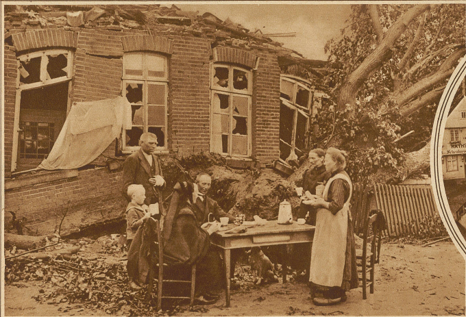
Die Unwetterkatastrophe in Holland und Deutschland. Zu gleicher Zeit, als große Gebiete der Schweiz von schweren Hagelwettern heimgesucht wurden, wütete über Holland und den angrenzenden Teilen Deutschlands ein schrecklicher Orkan. Der Schaden erreicht einige Millionen Franken