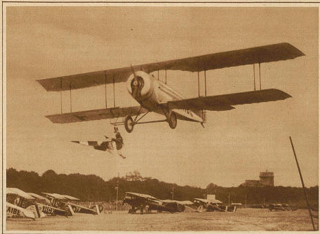
Aus dem Flugmeeting in Vincennes. Der am Trapes hängende Flieger Toutain hebt eine nur 6 m über dem Boden aufgehängte Fahne ins Flugzeug