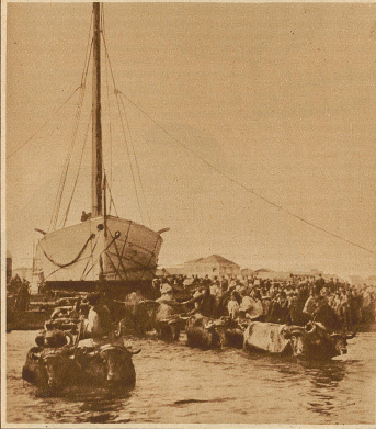
Ein origineller Stapellauf in Spanien. Das Schiff wird von 18 Baffelochsen ins Meer gezogen

Gegen 2 Uhr morgens entgleiste bei Bessay ein Wagen eines Güterzuges. Im gleichen Augenblick brauste aus entgegengesetzter Richtung der Schnellzug Paris-Nîmes heran und fuhr in voller Fahrt auf den entgleisten Wagen auf. Aus den Trümmern wurden 9 Tote und 16 Schwerverletzte geborgen.