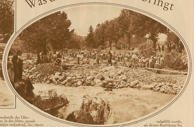
Uebersicht über die Verheerungen