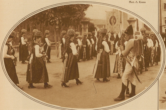
Prozession in Dädigen