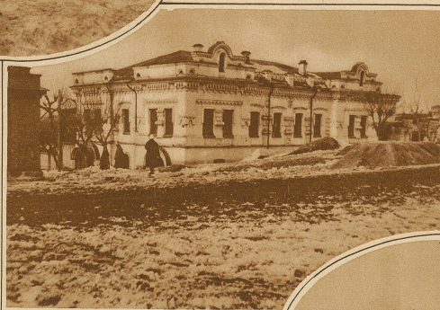
Das Schloß, der Verbannungsort der Zarenfamilie

namisches Fahren an Geschwindigkeit zu verlieren. Um diesen Gasverlust zu vermeiden und damit die Flugweite des Luftschiffes zu vergrößern, wird bei dem im Bau befindlichen Zeppelin auf Vorschlag von Dr. Eckener für den Betrieb der Motoren erstmalig überhaupt kein flüssiger Brennstoff, sondern ein schweres Kohlenwasserstoffgas verwendet werden, dessen spezi-