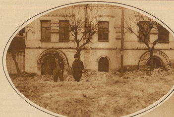
Die Rundbogen-Eingänge zum Keller, in welchem die Zarenfamilie erschossen wurde

Bisher mußte bei längeren Fahrten eines Luftschiffes, wenn der mitgeführte Vorrat an flüssigen Brennstoffes allmählich geringer wurde, die dadurch hervorgerufene Verminderung des Luftschiffgewichtes durch Ablassen einer entsprechenden Menge von Wasserstofftraggas ausgeglichen werden, um nicht durch zu starkes dy-