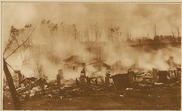
Eine große Explosionskatastrophe zerstörte am 7. Juni die Futurlieger in Wisokowice bei Krakau. Durch die Explosion wurden mehrere Häuser der Umgebung zerstört und über 400 Personen verletzt