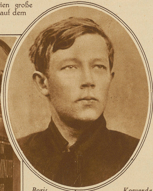
Boris Koverda der Mörder des russisch. Gesandten Wofkow