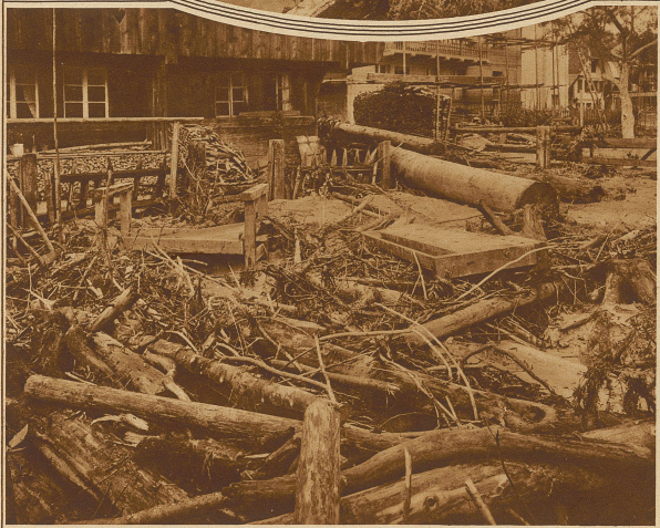
Einst ein Blumen- und Gemüsegarten, jetzt ein wüstes Trümmerfeld

Eine originelle Warnung hat der Weibel einer Gerichtskanzlei über den Akten der sich mehrenden Automobilprozesse aus einem Schädel und dem Rad eines verunglückten Autos konstruiert