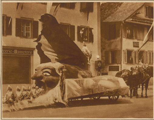
Der Wagen «Gnomenfahrt» im Umzug