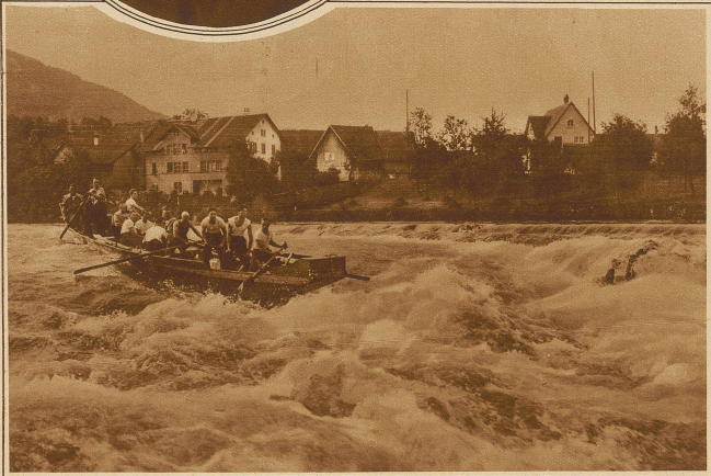
Schwierige Durchfahrt durch das Wuhr bei Vogelsang