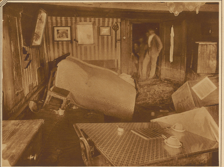
Eingestürzter Zimmerboden. Die Möbel schwimmen in Schlamm und Wasser