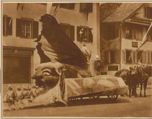
Der Wagen «Gnomenfahrt» im Umzug