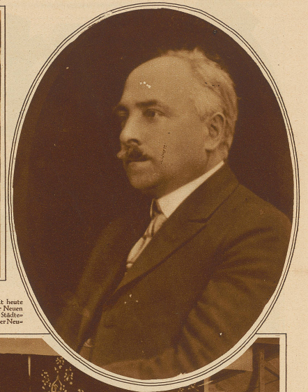
Bild rechts: Paul Blumenstein, ein Bieler Architekt, gilt heute als einer der größten und kühnsten Architekten der Neuzeit. Er ist der Schöpfer großer Pläne für amerikanischen Städtebau und beschäftigt sich gegenwärtig auftragsgemäß mit der Neubebauung des Ostens von New York.