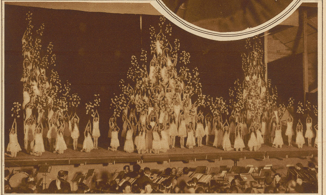
«Rosenbaum» ein Bild aus dem Festspiel